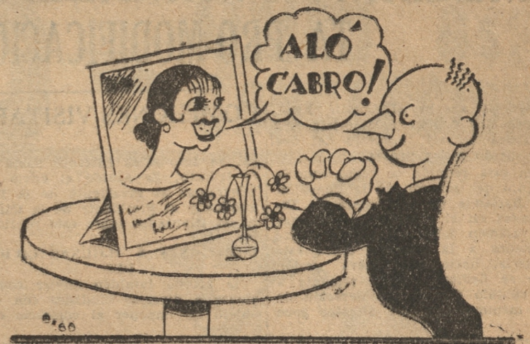
(De "El Romancero de Pipo") FOTOGRAFIA SONORA