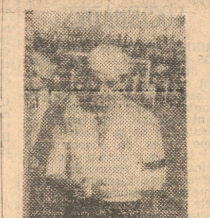
SORREL. Es uno de los mejores valores del Colo Colo de Santiago

Los informes del representante santiaguino han sido enteramente favorables y la gira, en caso de realizarse, se verificará en Noviembre próximo.