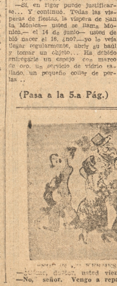
—¿Cómo, doctor, usted viene también a bailar? —No, señor. Vengo a repasar la anatomía.

—¿Posee también el perro ese sentido de la orientación? —No; el perro se guía por su olfato, que es sencillamente maravilloso; pero hay, no obstante otro animal que lo supera en esto: el cerdo. El oído del caballo es igualmente de una delicadeza exquisita. Resuerda y distingue perfectamente la voz de todos los que con él se relacionan. Pero lo asombroso del caballo no es esto, sino su sentido calculador. En esto, y por raro que pueda parecerle, es incluso superior al mismo hombre. Los célebres caballos de Eberfeld, citados por la Maeterlinck, que su man, restan, multiplican, dividen, elevan a potencias y extraen raíces, distan mucho de constituir una excepción. La mayoría de los ejemplares de la especie puede realizar el mismo trabajo después de convenientemente educados.