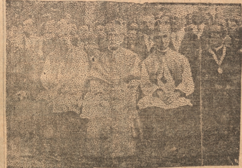
LOS OBISPOS DURANTE LA ROMERIA DE AYER

pezo la romería a ponerse en marcha en dirección al Cerro de la Virgen. Encabezaban la columna las sociedades de las parroquias de San Juan de Mata y de la Vice-Parroquia de La Pampa, todas con sus estandartes e insignias. Seguían a continuación las parroquias de San Agustín, La Merced,