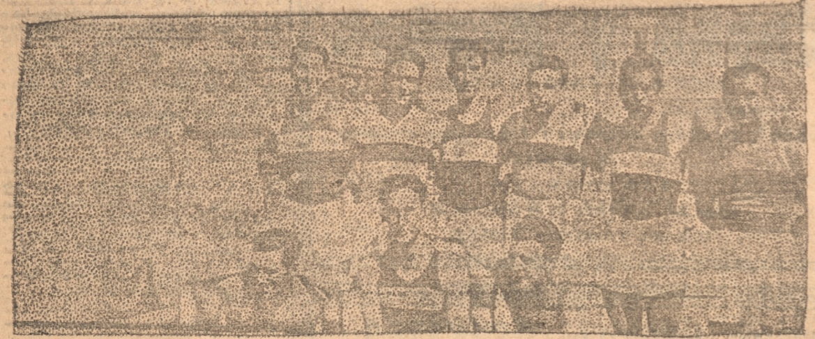
LOS MAGNIFICOS EQUIPOS DE VALPARAISO Y VIÑA DEL MAR