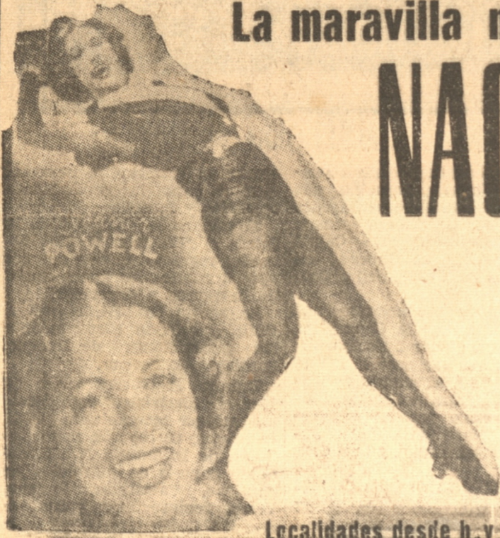
Localidades desde h. y.