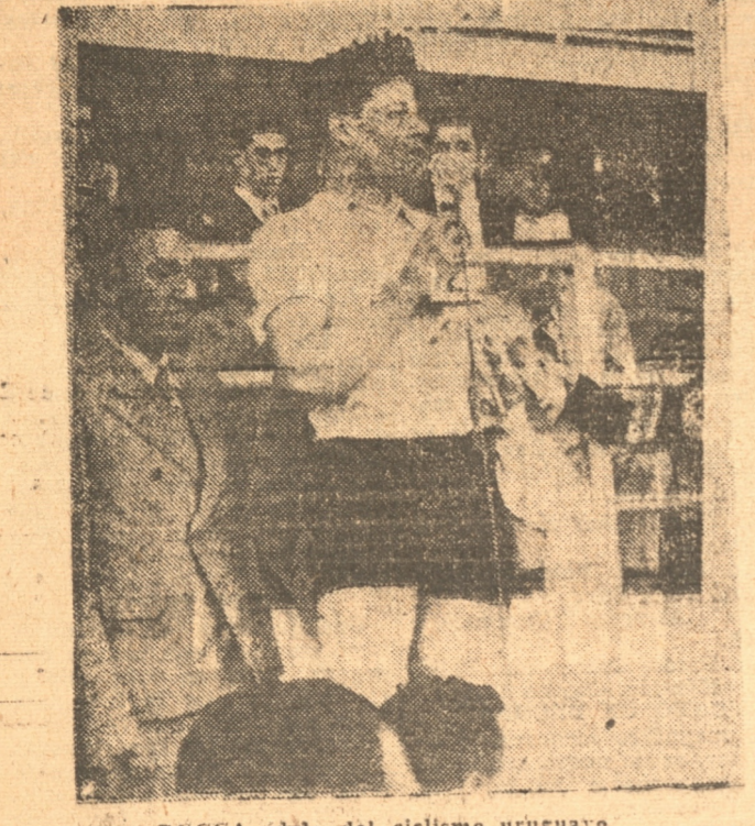
ROCCA idolo del ciclismo uruguayo

La figura principal del reciente Campeonato Sudamericano de Ciclismo realizado en Chile, con motivo de la inauguración del Estadio Nacional fué el uruguayo Leonel Rocca, clasificado vencedor y recordman sudamericano en dos de las pruebas oficiales del gran torneo.