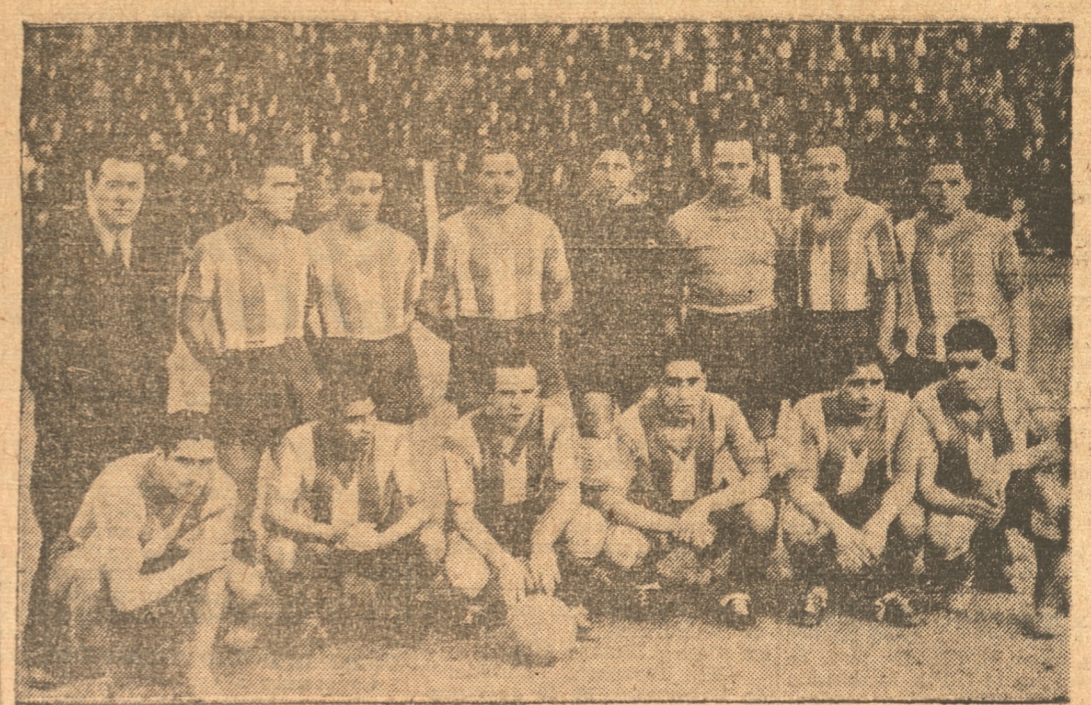
MAGALLANES CAMPEON PROFESIONAL DE SANTIAGO