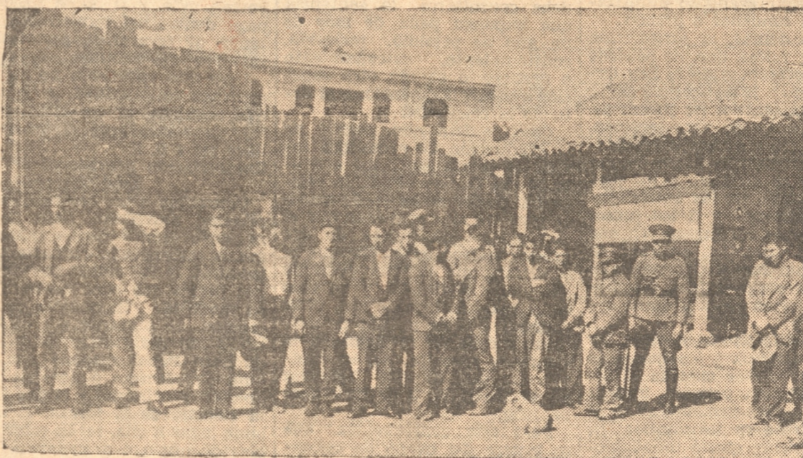
ALGUNOS DE LOS REOS DE LA CARCEL FORMADOS EN UNO DE LOS PATIOS DEL ESTABLECIMIENTO

ARV. Lave su Ropa con Jabon GRINGO M. R. "Yes Yes mucho bueno" ES PROPIEDAD = INSCRIPCION N.º 2122