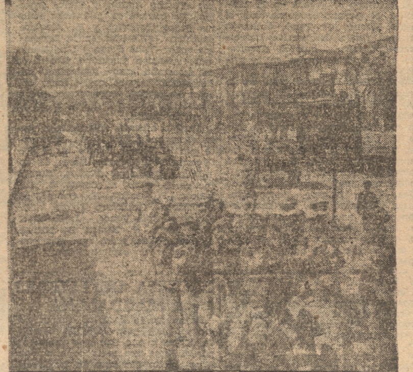
ASPECTOS DEL CORTEJO EN LOS FUNERALES DE DON TOMÁS RIOSCO CRUZAT