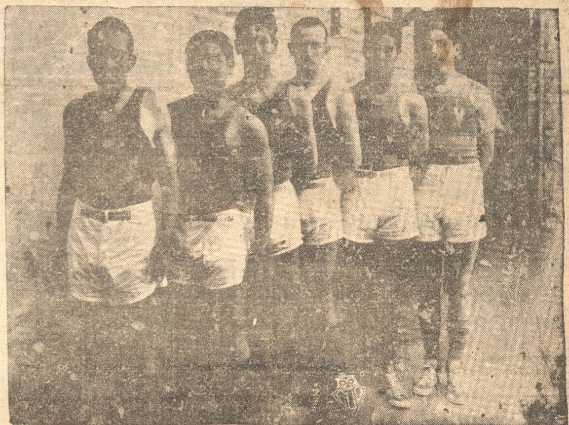
EQUIPO DE BASKETBALL DE LA UNIVERSIDAD PENQUISTA, QUE ESTA NOCHE DEFIENDE SU TITULO DE CAMPEON UNIVERSITARIO DE CHILE