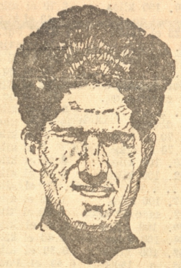
SANTIBÁÑEZ, excelente atleta de los visitantes

En esta eliminatória, los correspondientes "despedazarse" a los equipos de las Universidades de Chile y de Concepción. Los defensores de esta última, defenderán su título de Campeones Universitarios de Chile.