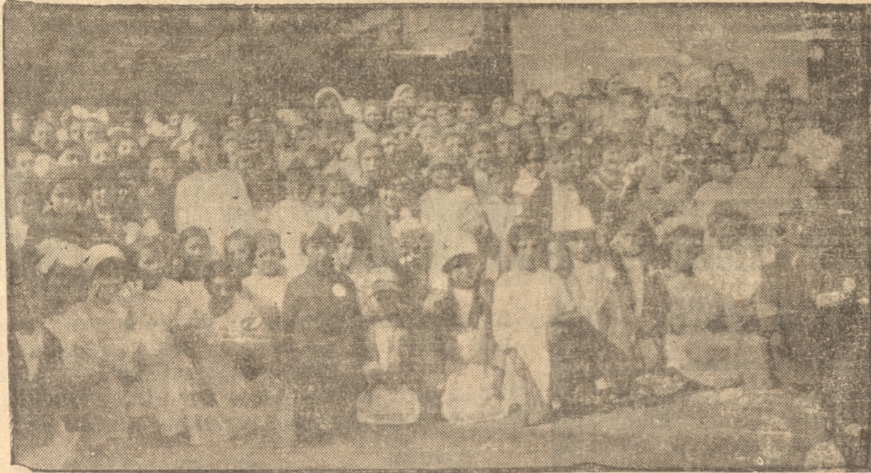
NIÑAS QUE TAMBIEN TOMARON PARTE EN ESTE PASEO

En la tarde de ayer llegaron a Concepción, más o menos cuatrocientos niños de ambos sexos con el objeto de visitar la ciudad y sus principales paseos; todos venían de Lota, donde se había organizado con todo entusiasmo este viaje.