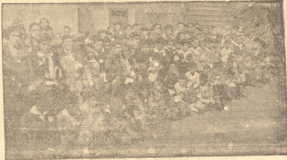
UN GRUPO DE NIÑOS COLEGIALES DE LOTA ALTO QUE AYER VISITARON LA CIUDAD