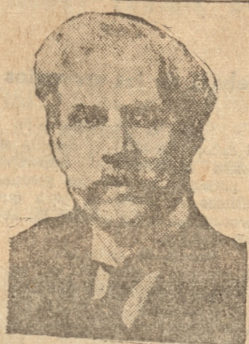
Mr. RAMSAY MAC DONALD, jefe del Gobierno nacionalista que triunfó en las elecciones

LONDRES, 28 (U. P.) — A su llegada a Downing Street, esta mañana a las 10 horas, Mr. Ramsay MacDonald hizo las siguientes declaraciones: