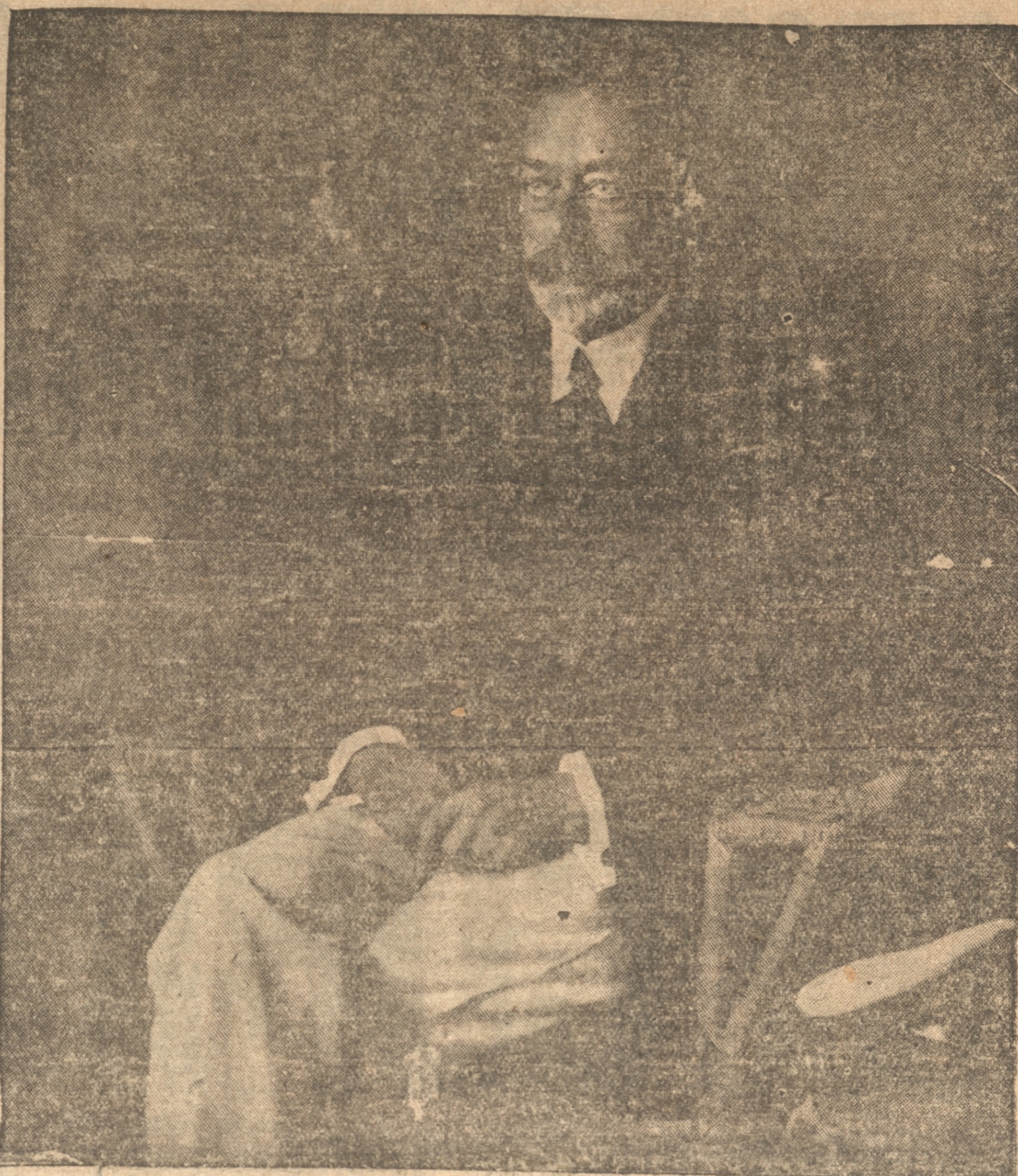
JORGE V DE GRAN BRETAÑA QUE CELEBRA HOY EL ANIVERSARIO DE SU NATALICIO