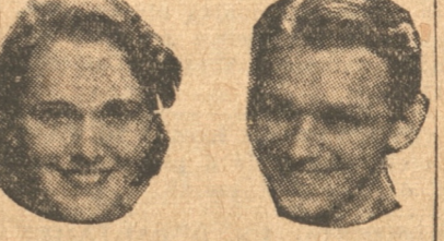
un puesto envidiable entre los artistas de la pantalla.

cuadrilla de la Aurora", y otras más, en las que ha revelado sus brillantes condiciones. El estreno de hoy en el Teatro Rialto, "Entre dos corazones", es protagonizado por Douglas Fairbanks Jr. y aquí el público tendrá una nueva ocasión para apreciar sus dotes de artista. Rose Hobart, la simpática protagonista de "El Corazón de Borneo", estreno del martes pasado, secundada a Douglas Fairbanks en su labor interpretativa.