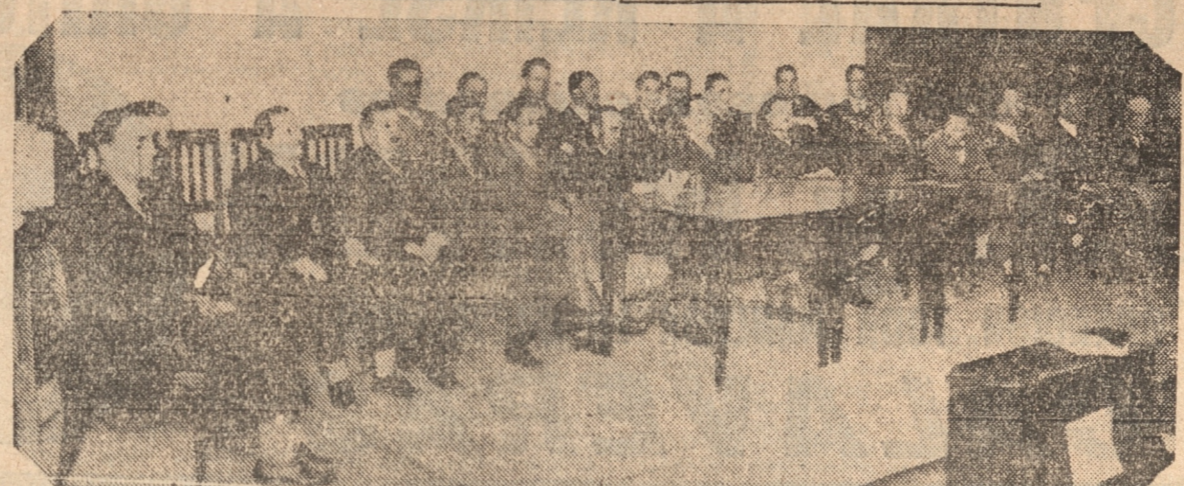
LA MESA DIRECTIVA Y LOS CANDIDATOS EN LA PROCLAMACION DE LOS CANDIDATOS CONSERVADORES

TEXTO DEL DISCURSO PROGRAMA CON NOTABLES CONCEPTOS DE PALPITANTE ACTUALIDAD QUE ESTE CANDIDATO PRONUNCIO ANOCH EN LA GRANDIOSA ASAMBLEA DE PROCLAMACION EN EL TEATRO RIALTO