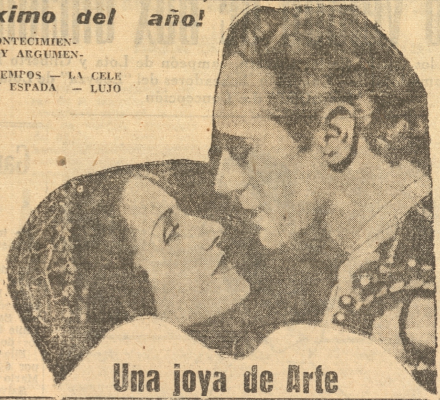
Una joya de Arte

EDNA MAY OLIVER - BASIL RATHBONE y RALPH FORBES