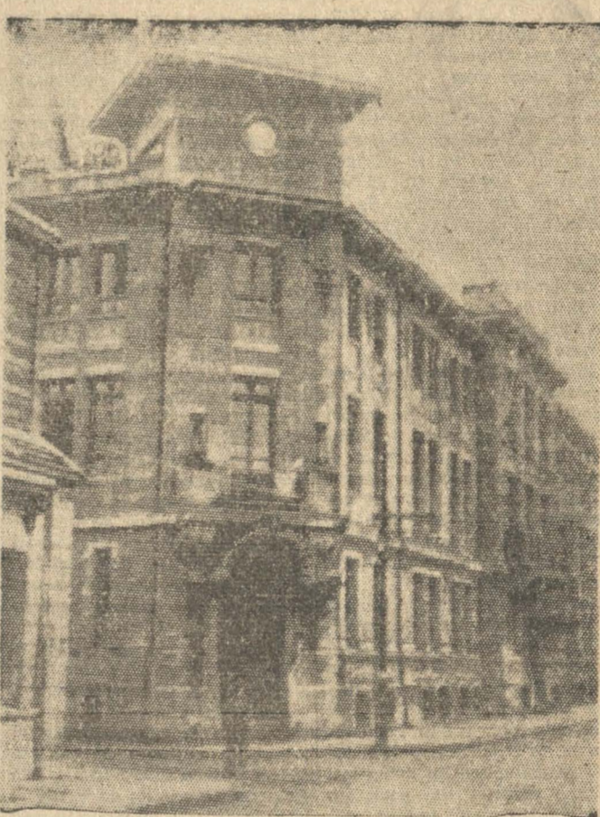
ACTUAL EDIFICIO DEL LICEO