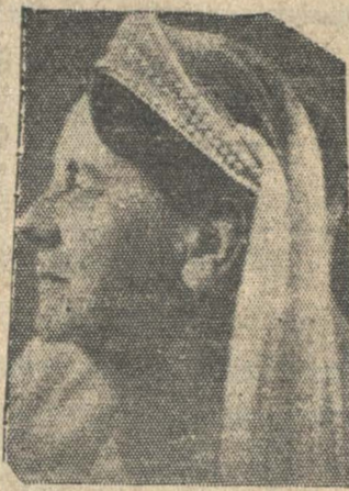
GUILLERMINA, la soberana de Holanda, cuyo país ha sido invadido por Alemania.

Se informa que los aviones alemanes fueron avistados volando sobre varios puntos al norte de Arnhem, incluso Amsterdam, Kat