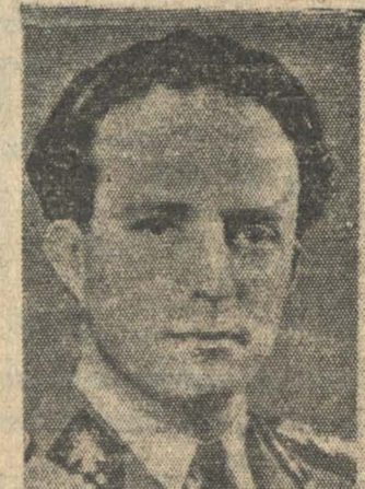
El rey LEOPOLDO de Bélgica, país también invadido por el Reich

Se ha informado que 50 aviones no identificados vuelan sobre Nijmegen.