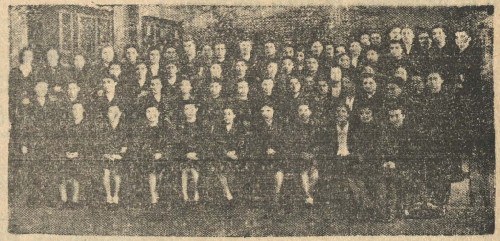
ALUMNAS DEL 5º AÑO B. DE HUMANIDADES DEL LICEO