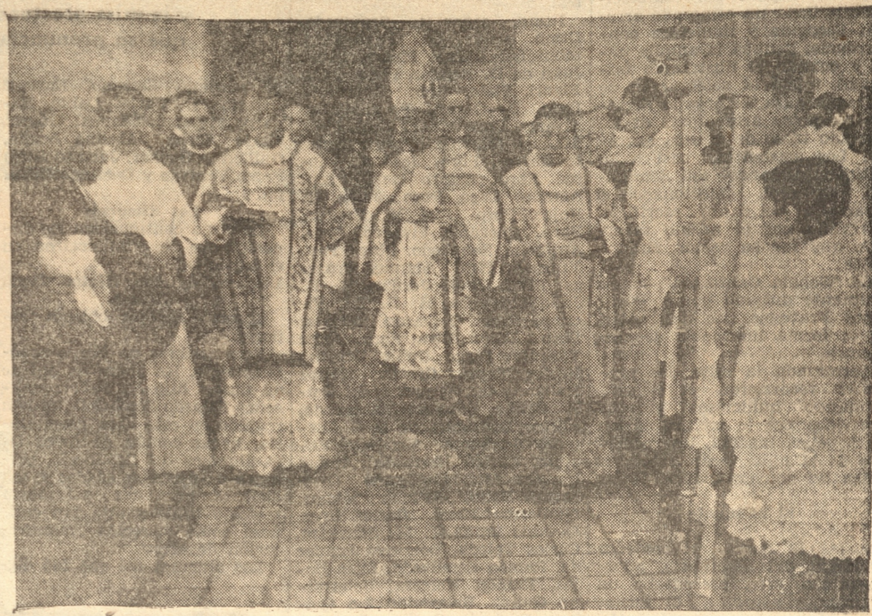
DURANTE LA CEREMONIA DE LA BENDICION DE LA TORRE