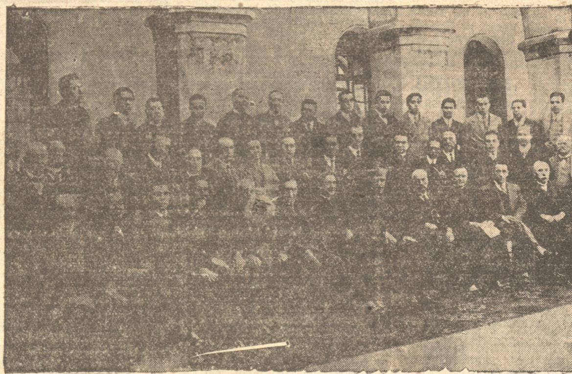
UN GRUPO DE ASISTENTES A LAS FESTIVIDADES.

Quizas, Ilmo. señor, si en vuestras horas de asedia y de tristeza, habréis dudado de la eficacia de tan hermoso apostolado educador; quizás si el Señor, para probaros, os oculta la magnitud de tan óptima cosecha; pero cuando a la luz que no engaña del verdadero día hagáis el último y definitivo examen de conciencia, vuestros ojos quedarán, sin duda, deslumbrados: vuestros discípulos formarán entonces la fúlgida corona en vuestra frente limpia y despejada; y empararéis de nuevo a comun icar con ellos, más allá de la tumba, el pensamiento transcendental que descifra al sereno problema de la vida.