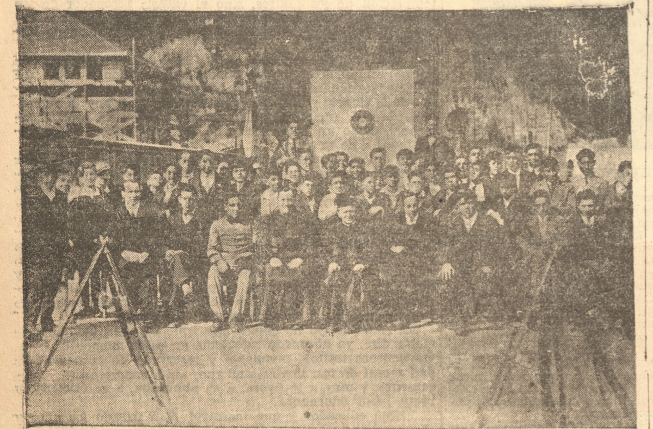
ASISTENTES AL ALMUERZO EFECTUADO EN EL SEMINARIO EN HONOR DE MON- SEÑOR SEPULVEDA

Muy hermosos recuerdos ha dejado en el ánimo de los asistentes.— La misa. —El almuerzo.— La velada constituyó el número final