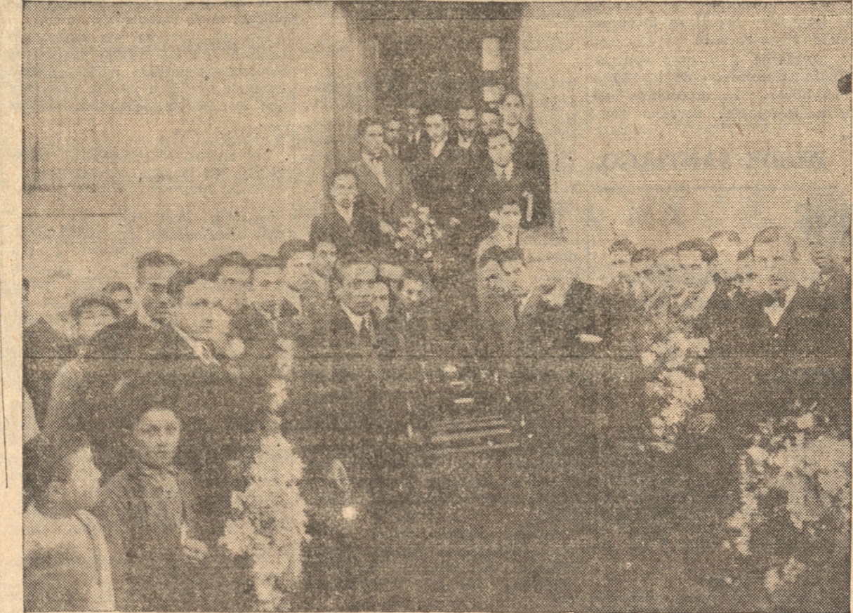
LOS RESTOS AL SER SACADOS DE LA CASA DEL EXTINTO PARA LLEVARLOS AL CEMENTERIO

Pocas vidas encierran como la suya tan máxima lección de compañerismo. El corazón de Ballesteros no valía menos que su cabeza; con ejemplar desinterés, con desprendimiento casi bíblico, dedicó sus mejores