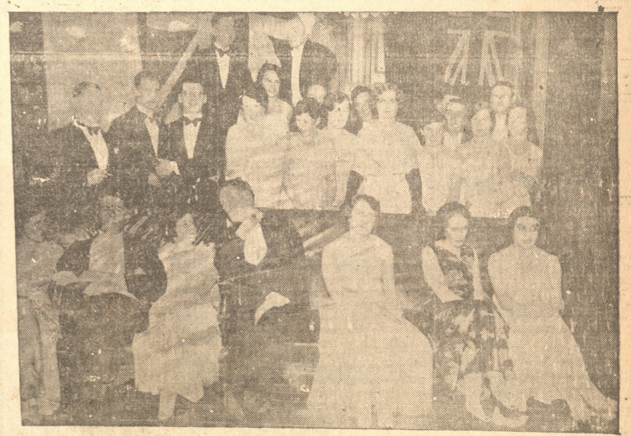
Grupo de asistentes al baile efectuado antenoche en el Club Inglés, con motivo del Empire Day.

El gracioso grosero es un imbecil que anda buscando una vértebra cervical en un estercolero.