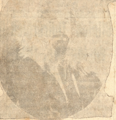
SIR HUBERT WILKINS

Groenlandia, y desde el extremo noreste de Groenlandia continuará esta vez rumbo casi directo al Polo Norte.