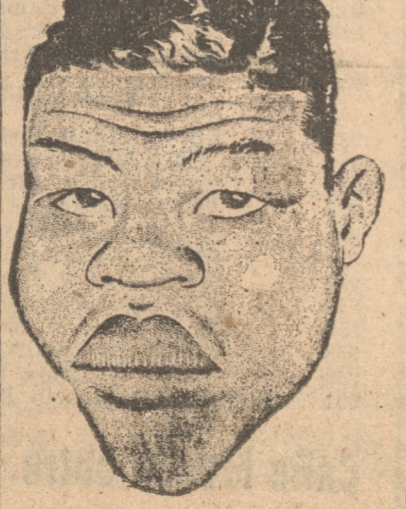
EL NEGRO JOE LOUIS

En efecto, pelearán el italiano "El Negro" Carnera ex campeón mundial de