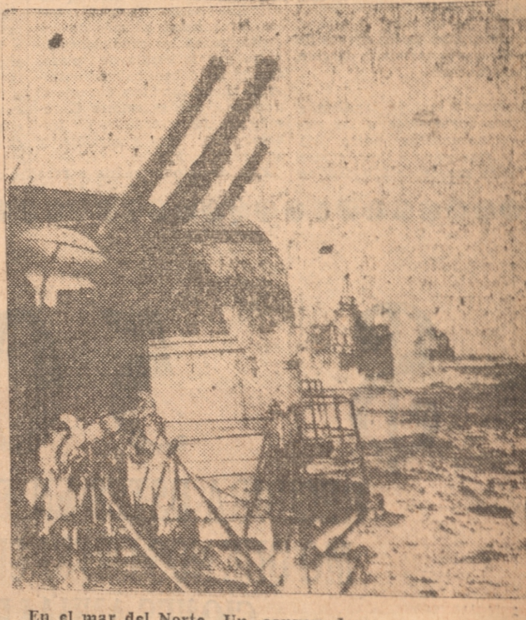
En el mar del Norte. Un convoy de naves mercantes escoltado por un grupo de barcos de guerra británicos.