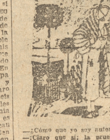
—¿Cómo que yo soy autoritario? — ¡Claro que sí; la prueba es que nunca me obedecí!

cia de Europa. Lo sometieron a numerosos exámenes. Zaro decía que no fumaba ni bebía y que procuraba siempre trabajar en algo. En 1930 decidió recorrer el mundo; visitó Europa y Estados Unidos, donde sin duda, algún avisado empresario lo exhibió como un fenómeno. Era alegre, decidía con seriedad y su memoria era perfecta como una lanza y media un metro ochenta de estatura. Al fallecer, en Estambul su hijo ya nonagenario autorizó la autopsia del cadáver. Los médicos le encontraron el germen de la tuberculosis en los pulmones y el corazón considerablemente dilatado. Pero Zaro Agha no murió ni de una ni de otra cosa sino de un brusco ataque de uremia. Poco antes de fallecer pareció que el doctor Veronoff le había ofrecido rejuvenecerlo y él había contestado que "¡amara se sintiera tan joven!". Este hombre, que había visto tantas crueldades, tantas injusticias, tantos dolores, se aferraba a la vida. Seguramente que la edad ahuyentó su sensibilidad. ¡En ciento sesenta años de existencia, ya se pueden contar cosas!