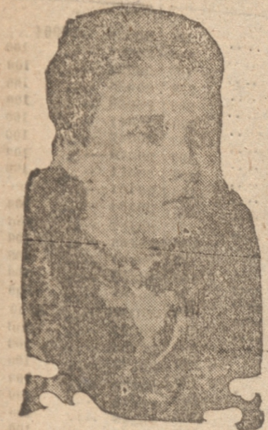
OTTO HAPSBERGO, a quien se pensaría poner en el trono de Austria.

Von Starhemberg fué a Italia con el propósito aparente de visitar un campamento de muchachos austriacos. — En su reunión con el Duce, conversó sobre los principios generales del carácter de la monarquía. — Con esta conferencia avanzan las gestiones para la vuelta de los Hapsburgos al trono austriaco