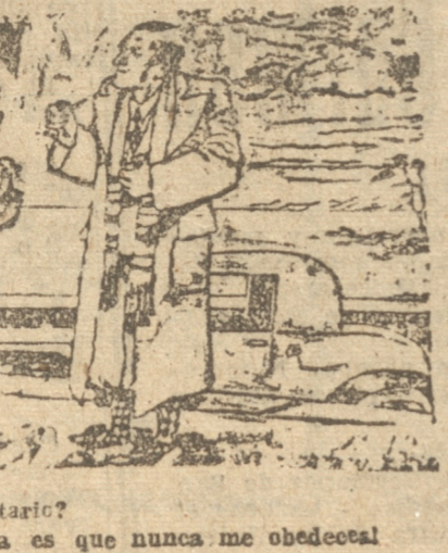
—¿Cómo que yo soy autoritario? — ¡Claro que sí; la prueba es que nunca me obedecí!

MARK TWAIN No era muy conocido en Estados Unidos el verdadero nombre del humorista. A un reportero que le preguntó cómo se llamaba, contestó Mark Twain que no sabía a punto fijo, y ante el asombro del periodista, agregó: —Eramos dos mellizos. Nos pusieron en una bañera; uno se ahogó, y jamás se supo cuál de los dos fué el muerto. Sin embargo, "el que se salvó" se llamaba Samuel Langhorne Clemens.