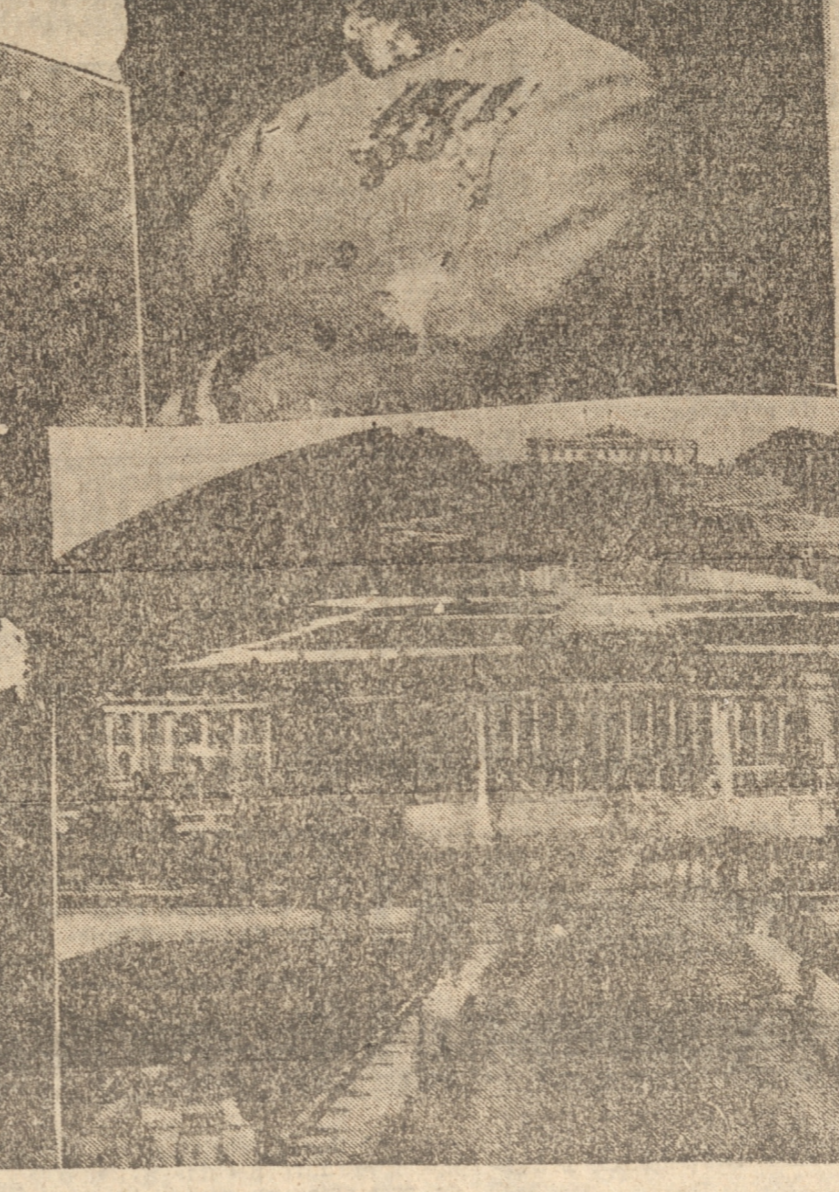
(1) EL PRINCIPE OTTO, JEFE DE LA CASA DE HABSBURGO Y PRETENDIENTE AL TRONO DE HUNGRIA, COMO PRIMOGENITO DEL DESTRONADO EMPERADOR CARLOS. — (2) EL ARCHIDUCO FRANZ SALVATOR, QUE HA RENUNCIADO A TODOS LOS DERECHOS AL TRONO PARA EL Y LOS SUYOS, A FIN DE PODER SEGUIR RESIDIENDO EN VIENA. — (3) UNA VISTA DEL PALACIO REAL DE SCHONBRUNN, EN LAS PUERTAS DE VIENA, ANTIGUA RESIDENCIA DE LOS EMPERADORES. HOY ESTA DESTINADA A RECREO PUBLICO.