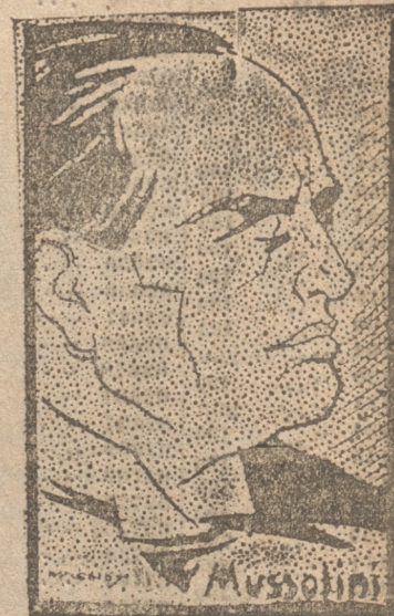
MUSSOLINI, quien apoyaría la vuelta de los Hapsburgos al trono de Austria

Autorizadamente se sabe que ambos discutieron los principios generales pues aun no se ha llegado al punto al cual se discute el carácter específico de la monarquía.