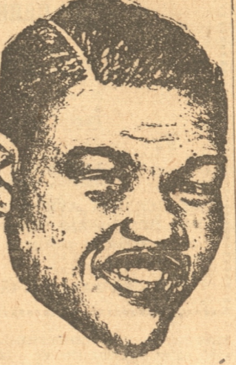
YANKEE STADIUM, 22.—(UP).—Donovan detuvo la pelea a los dos minutos cuatro segundos después de empezarla.

Preparó el camino para una colaboración en tres convenciones internacionales sobre no trabajo y otras dos destinadas a proteger la labor de los obreros nativos y a controlar a los obreros ambulantes.