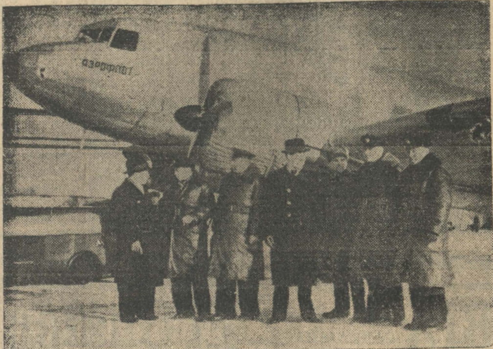
El primer avión ruso que ha llegado a Berlín.— La Compañía soviética "Aeroflott" inició hace pocos días su primer vuelo de prueba sobre la ruta Moscú-Koenigsberg-Berlin. Aparecen aquí los pilotos y tripulantes rusos momentos después de llegar a Berlín