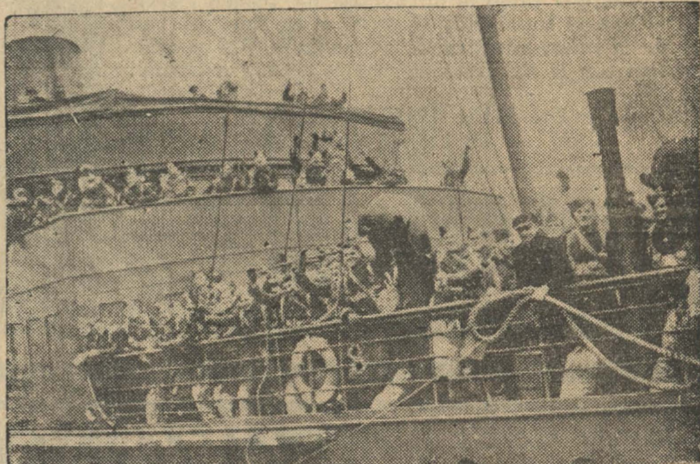
TROPAS CANADIENSES A INGLATERRA.— Soldados del Canadá a bordo del transportista que los conduce a Inglaterra para ir después al frente. El cable anuncia ahora que ha llegado a un "puerto del norte" de Gran Bretaña el primer destacamento de la Real Fuerza Aérea procedente de aquel país.