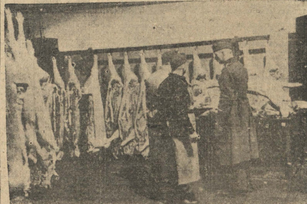
CARNE PARA LAS TROPAS.— He aquí la magnífica ración de carne para el almuerzo de un regimiento alemán destacado en el Frente del Oeste

aplastado. ESTAMBUL, 26. — No hay confirmación a las informaciones del exterior que hablan de un acuerdo turco soviético para el retiro de tropas. Los círculos bien informados han destacado que éstos es muy poco posible, y han agregado que ninguno de los dos países tiene tropas suficientes en la zona de la frontera para que ésta se sienta amenazada.