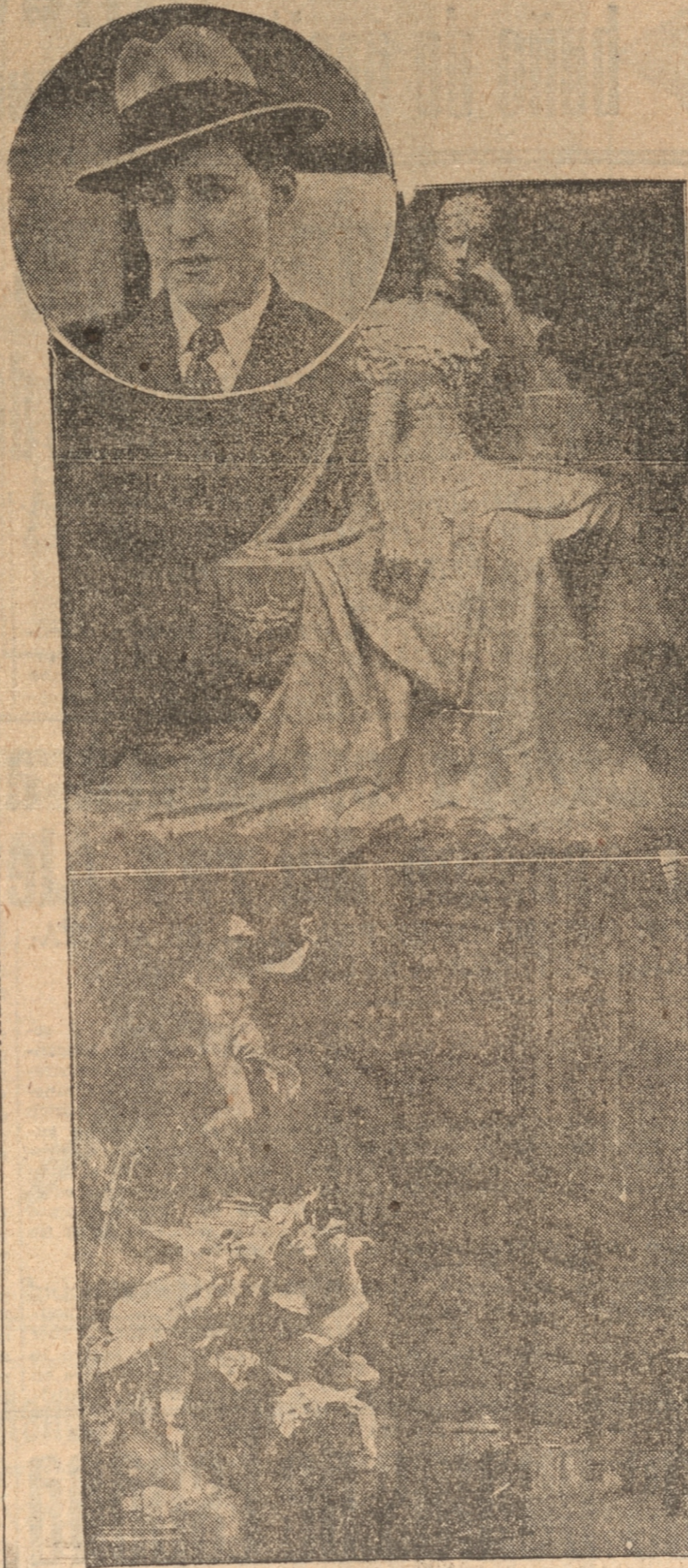
1) El ex infante don Gonzalo de Borbón y Battemberg, protagonista de la última tragedia que pesa sobre una rama de la descendencia de los Habsburgo. También en el día fatal volarían sobre el parque de Schoenbrunn los cuervos fatídicos.— 2) El monumento a la emperatriz Isabel de Habsburgo.— 3) He aquí la imponente y artística masa del Palacio Imperial de Viena, residencia de la casa reinante de los Habsburgo, hasta el cambio de régimen.

Pocas horas después empezó a sentir en la prisión donde se encontraba fuertes dolores, retorciéndose en la cama y haciendo precisa la asistencia del médico de la cárcel. El médico declaró que para salvar la vida del delincuente era preciso