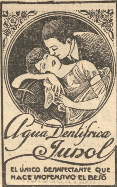
EL ÚNICO DESINFECTANTE QUE HACE INOPERATIVO EL BEBÉ