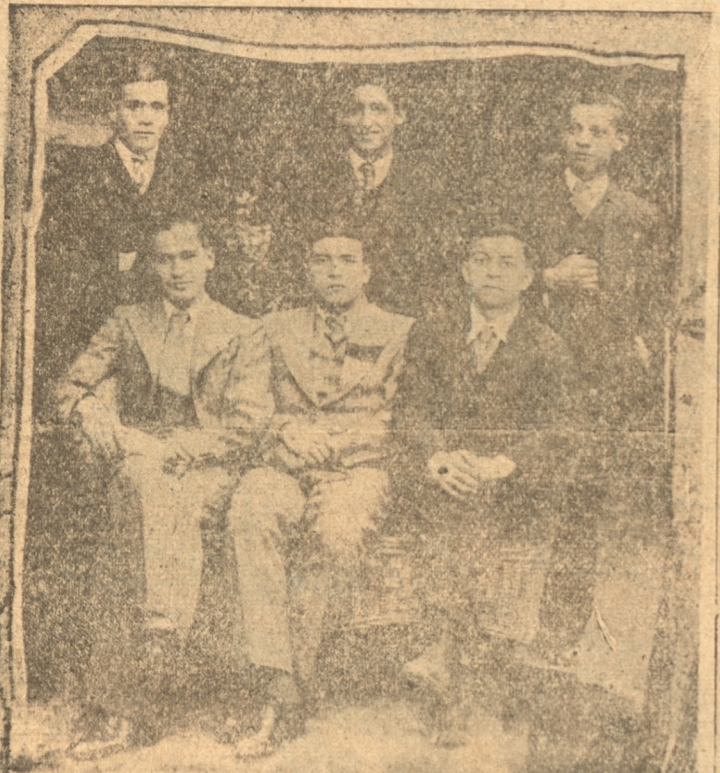
ALUMNOS QUE SE RETIRAN DESPUES DE TERMINADOS SUS ESTUDIOS