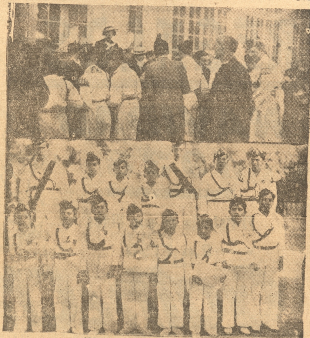
ALUMNOS RECIBIENDO LOS PREMIOS

No olvide! "LA PATRIA" está para servirlo