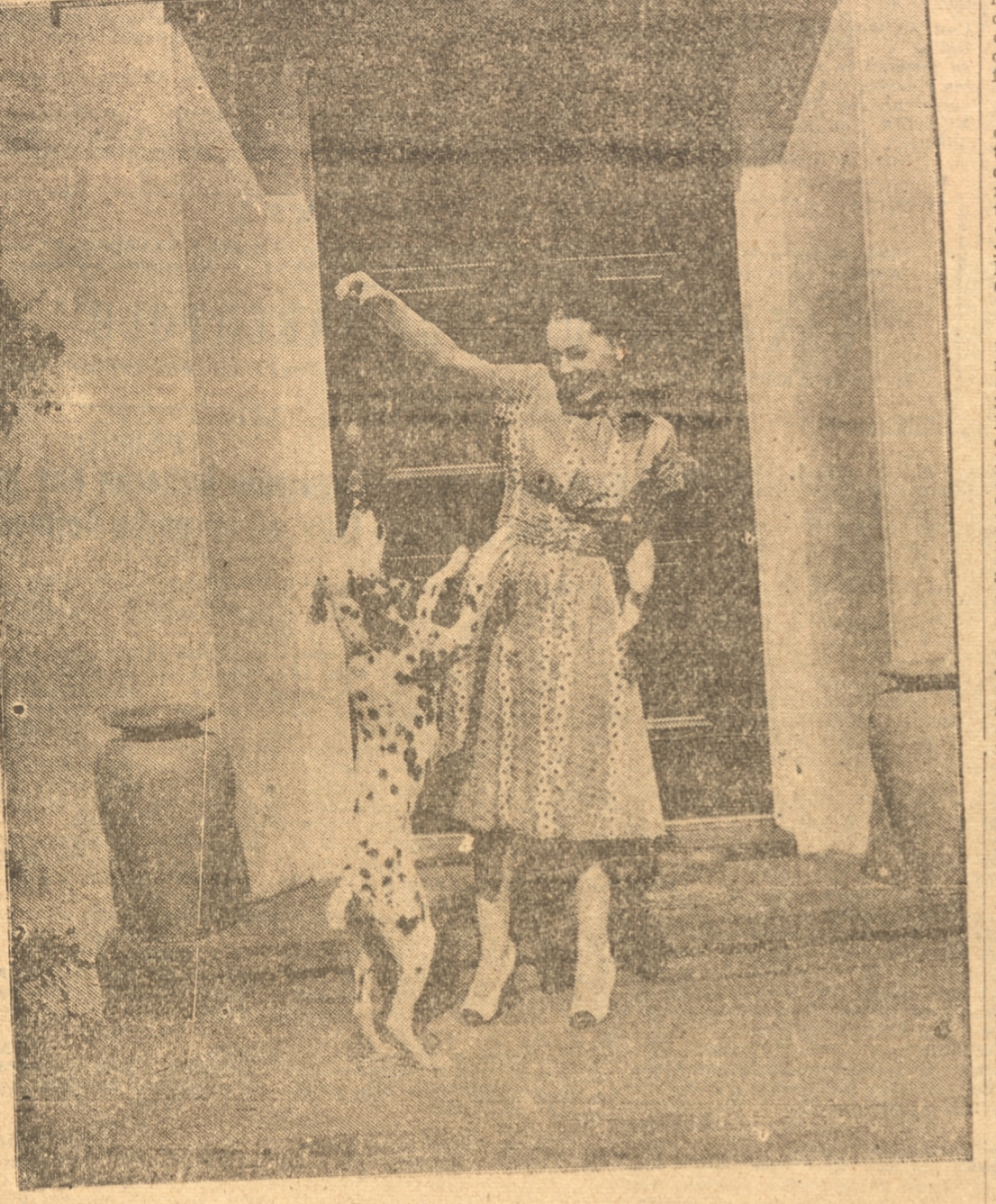
Maureen O'Sullivan atiende a la alimentación de su perro antes de salir para los estudios Metro Goldwyn Mayer