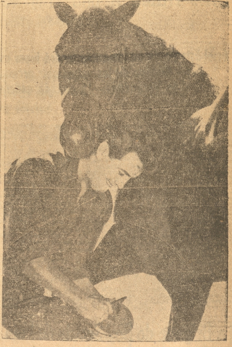
Robert Taylor, estrella de la Metro Goldwyn Mayer, pasa el tiempo que le deja libre la pantalla, en su granja del Valle de San Fernando

En los ojos de Mat se retrató la voz de una sorpresa.