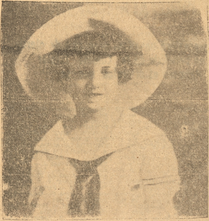
Jeanette MacDonald, estrella de la Metro Goldwyn Mayer, a la edad de cinco años