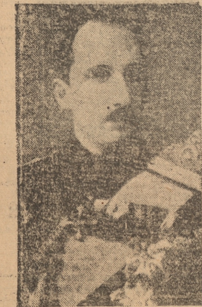
EL REY BORIS

No han prosperado las gestiones para organizar el Gabinete