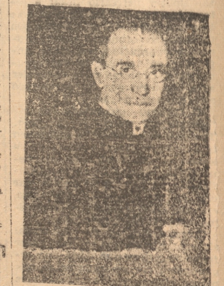
EL CARDENAL PACELLI