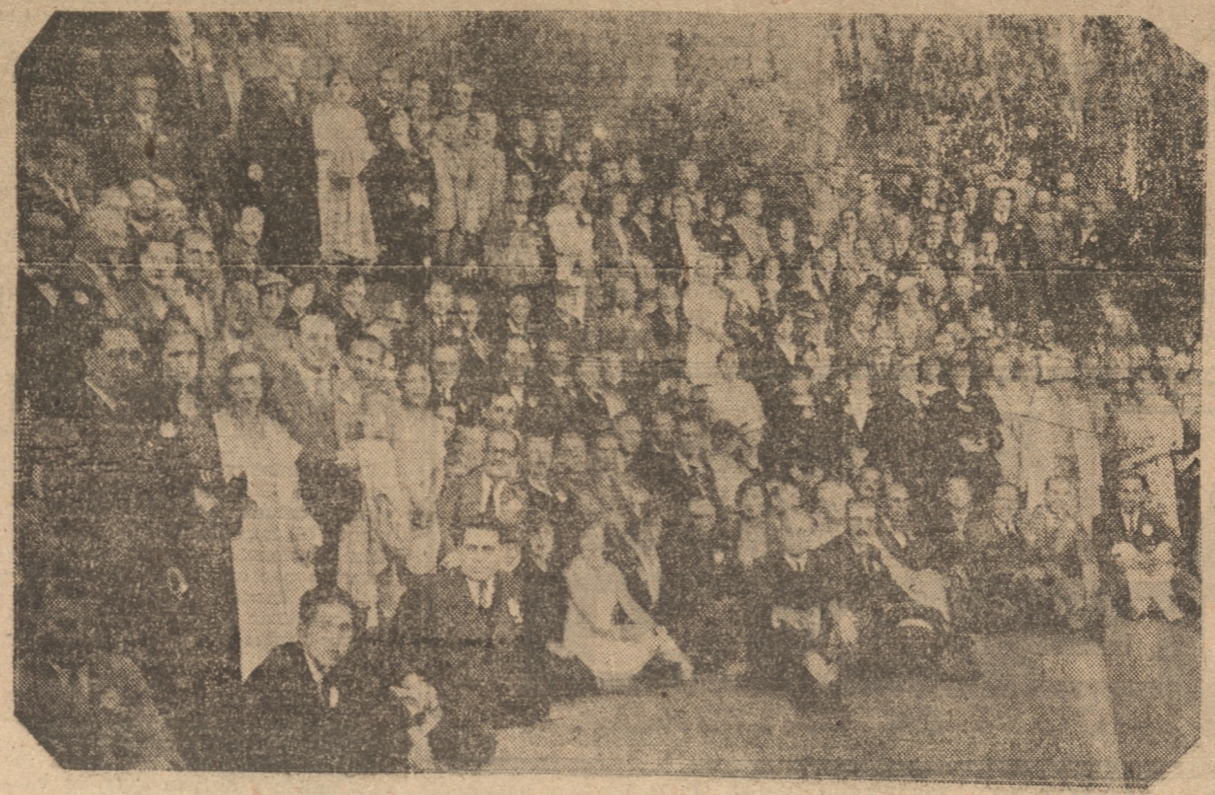
GRUPO OBTENIDO DURANTE LA VISITA AL BALNEARIO DE "EL MORRO" DE TOME