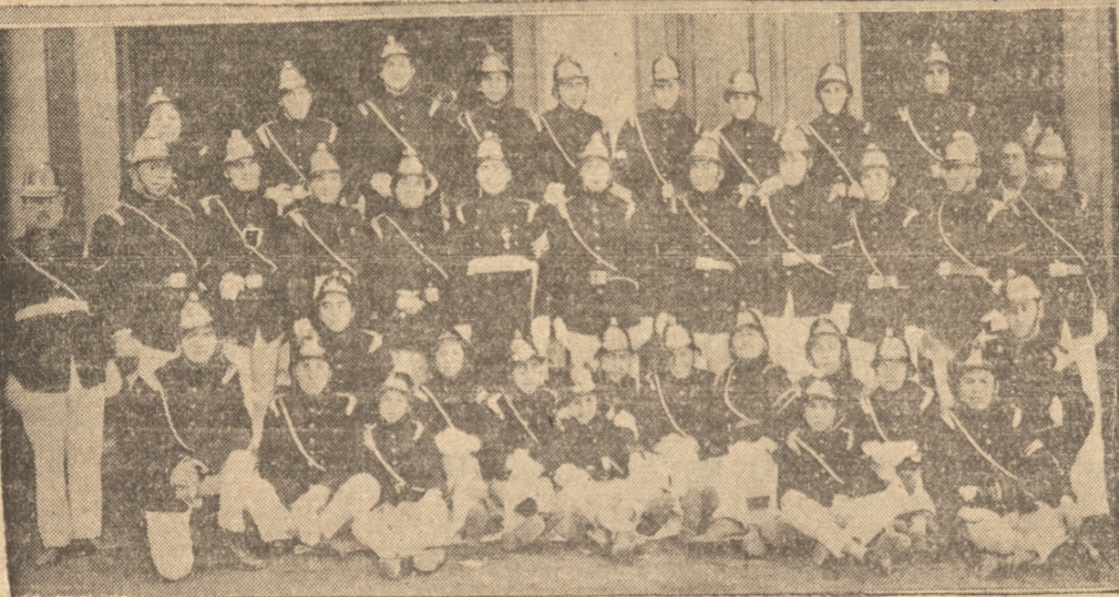
LA PRIMERA COMPAÑIA POsa PARA 'LA PATRIA'