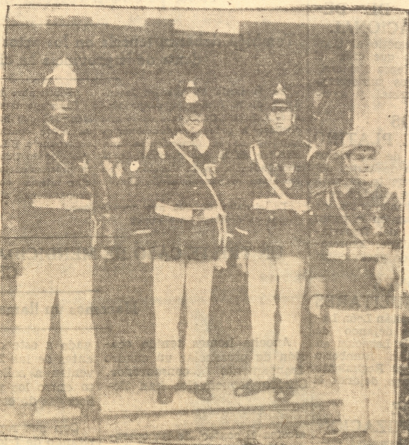
La Comisión del Cuerpo de Bomberos que recorrió las firmas comerciales.— 2.º Un voluntario colocando la insignia a una señorita.— 3.º Una de las comisiones

Mañana daremos a conocer algunos interesantes detalles de esta colecta y publicaremos listas de donantes.