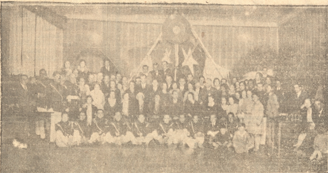
ASISTENTES AL BAILE DEL HOTEL FRANCE

ra de estrechez aunque pasaba, lo que obligaba a dirigirse a todos los amigos de los bomberos para pedirles su cooperación, con el fin de poder seguir en sus actividades que son de beneficio para todos en general sin distinción.