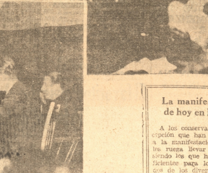
DIVERSOS ASPECTOS DE LAS SESIONES DE ESTUDIOS VERIFICADAS AYER PUEDEN OBSERVARSE LA MESA DIRECTIVA, UN ASPECTO DE LA CONCURRENCIA Y UNO DE LOS ORADORES HACIENDO USO DE LA PALABRA