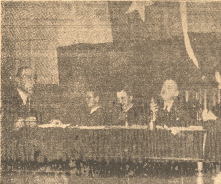
DIVERSOS ASPECTOS DE LAS SESIONES DE ESTUDIOS VERIFICADAS AYER PUEDEN OBSERVARSE LA MESA DIRECTIVA, UN ASPECTO DE LA CONCURRENCIA Y UNO DE LOS ORADORES HACIENDO USO DE LA PALABRA