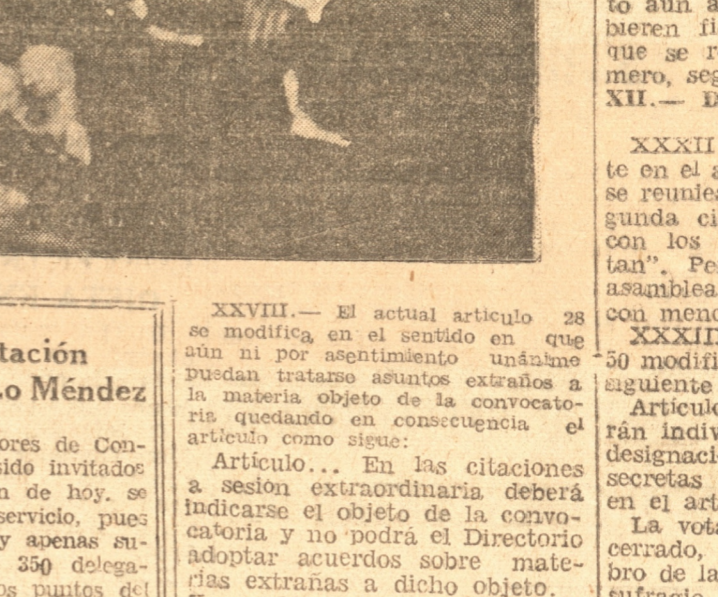
DIVERSOS ASPECTOS DE LAS SESIONES DE ESTUDIOS VERIFICADAS AYER PUEDEN OBSERVARSE LA MESA DIRECTIVA, UN ASPECTO DE LA CONCURRENCIA Y UNO DE LOS ORADORES HACIENDO USO DE LA PALABRA

asambleístas que hubieren votado por cada candidato. Se adoptará un procedimiento análogo en las Agrupaciones de Departamentos; pero en este caso, cada Directorio Departamental presentará dos nombres y la Junta Ejecutiva uno por cada candidato que se haya acordado presentar.