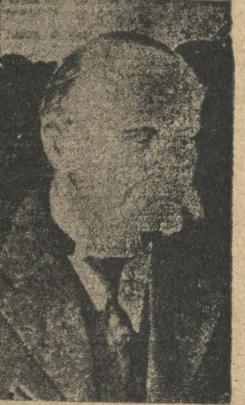
EL PRESIDENTE KALLIO, DE FINLANDIA, que ayer en sesión del Parlamento expresó que su país estaba dispuesto a negociar con Rusia una "Paz honrosa".

Los agricultores más jóvenes, de las clases de 1916 a 1919, todos veteranos de la guerra mundial, tendrán "Licencias agrícolas" siempre que vuelvan a sus labores agrícolas activas en el campo.