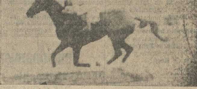
JARANERO en acción fácil pone fin a la reunión hipica del domingo.

REFINADA 564. — Nunca. NEVAZON 53. — De tabla no baja. ANCLA 53. — Pregúntele a don Lindor. DIOMEDES 52. — Este está para la historia antigua. HELOISA 51. — Nadie cree que esta fue a la pelea. HILVAN 50. — Está en la quemada.