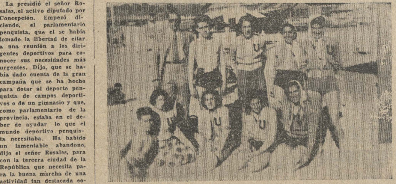
EL LENTE DE "LA PATRIA" ESTA EN TODAS PARTE — En efecto, anteaer en las playas de Penco nuestro fotógrafo Palma sorprendió a las universitarias de Santiago en interesante pose

Para presentar en buenas condiciones al seleccionado juvenil que representará a esta dirigente, se fijó el siguiente horario de entrenamiento: Día viernes 2 de febrero, entrenamiento de cancha; martes 6 de febrero, entrenamiento de cancha; miércoles 7 de febrero, clases teóricas en la secretaría de la Asociación y jueves 8 de febrero, último entrenamiento de cancha, a cargo de éllo estará la comisión nombrada con anterioridad y que pre-