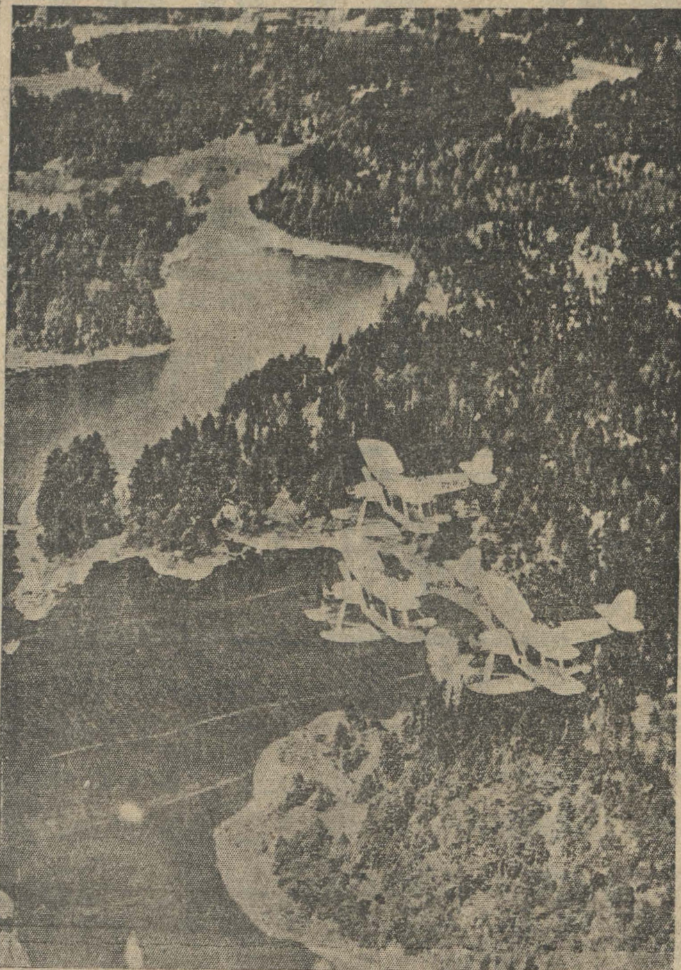
AVIONES VUELAN SOBRE LAS CIUDADES DE FINLANDIA Y SOBRE SUS LAGOS HELADOS. — Estos días la actividad aérea rusa fué inusitada, como el cable lo informó en su oportunidad. Ayer no hubo incursiones, pero en todos los frentes de batalla fueron detenidas las tropas soviéticas por los defensores.

El Presidente Kallio agregó: "No podemos confiar en las grandes masas para defendernos, pero ante los ojos del mundo entero el pueblo finlandés ha demostrado que es grande en su espíritu y en su sacrificio y de su fuerza moral con que ha defendido sus derechos y al mismo tiempo impedido la expansión del bolchevismo hacia el oeste".