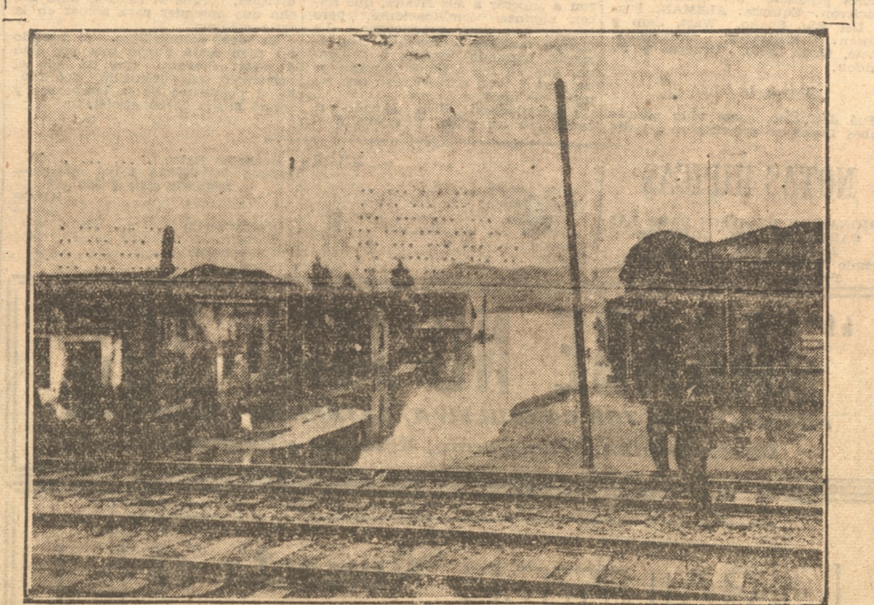
En calle Balmaceda las aguas del Bio-Bio, alcanzan cerca de la línea de los FF. CC. Varias casas han sido anegadas por la crecida. (Vea información en página interior)