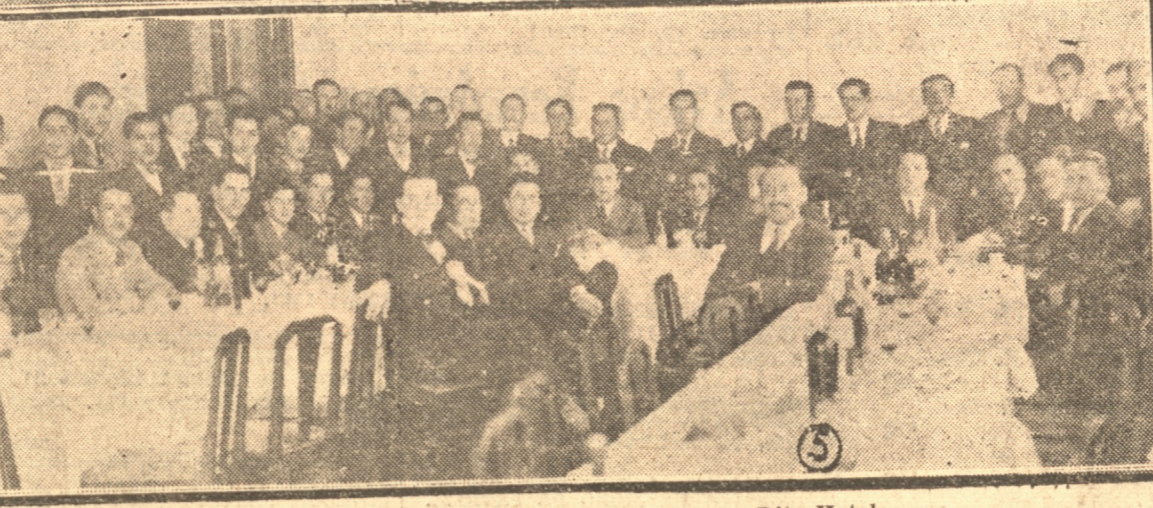
5.— Asistentes al almuerzo ofrecido ayer en el Ritz Hotel