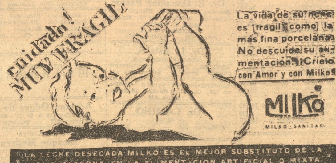
LA LECHE DESECADA MILKO ES EL MEJOR SUBSTITUTO DE LA LECHE MATERNA EN LA ALIMENTACION ARTIFICIAL O MIXTA.

Trabajo y de los parlamentarios asistentes a esta concentración, para que de alguna manera vuelvan a sus labores los obreros y empleados despedidos por causas sociales y políticas. El señor Zamora fue entusiastamente aplaudido. Durante su discurso tocó otros problemas de alto interés nacional como el mejoramiento de sus salarios de los tripulantes que prestan sus servicios en los vapores de la Asociación Nacional de Armadores y rindió un homenaje de admiración a las Compañías Nacionales, como la Refinería de Viña del Mar, en donde los obreros gozan de la más avanzada legislación social.