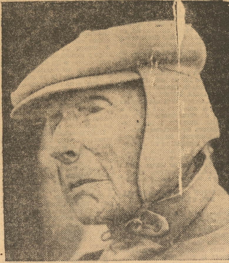
JOHN D. ROCKEFELLER

Poco después de medianoche se advirtieron los primeros indicios de su último fin, cuando cayó en estado comatoso. — No hizo ningún encargo final, pues no comprendió que moría declaró el médico que lo atendió en sus últimos momentos