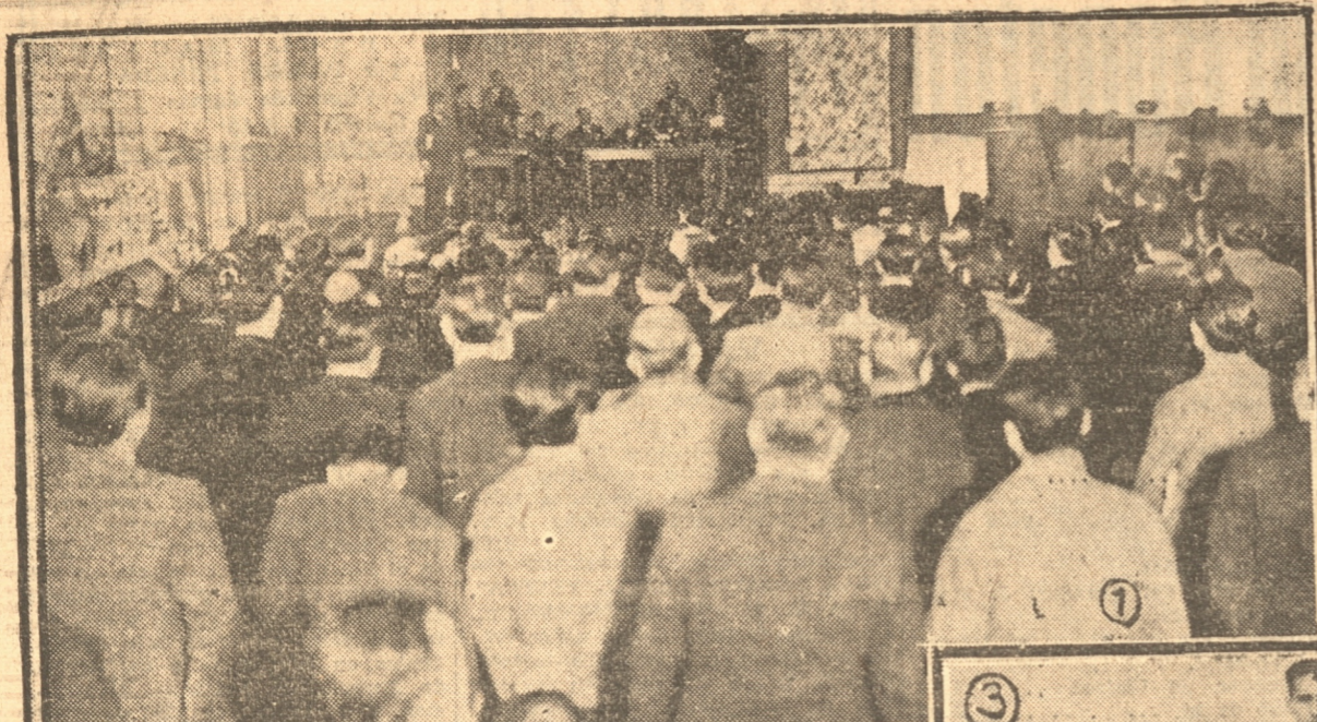
1.— Arriba.— Un aspecto de la concurrencia que acudió a la sesión de clausura de la Convención de Subsistencias, en el salón de "La Ilustración de la Mujer"