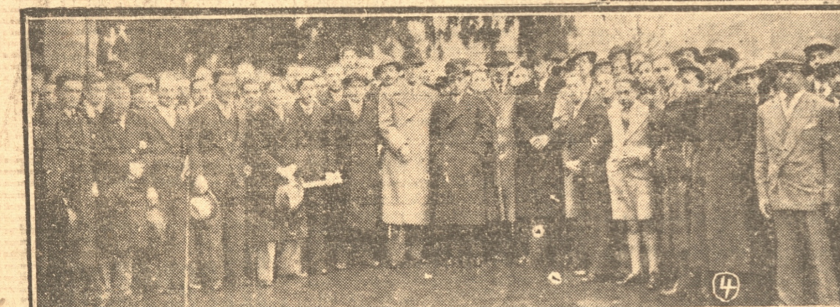
DELEGACION DE EMPLEADOS SE ENTREVISTO AYER CON EL SR. MINISTRO DE TRABAJO