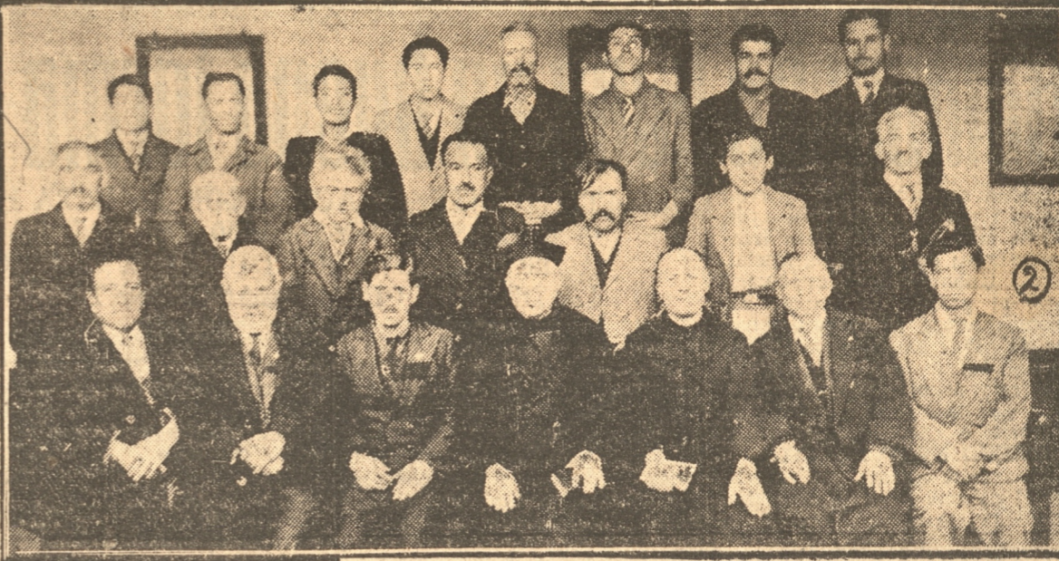
2.— Grupo de obreros católicos que asistieron al retiro que finalizó ayer en San Ignacio