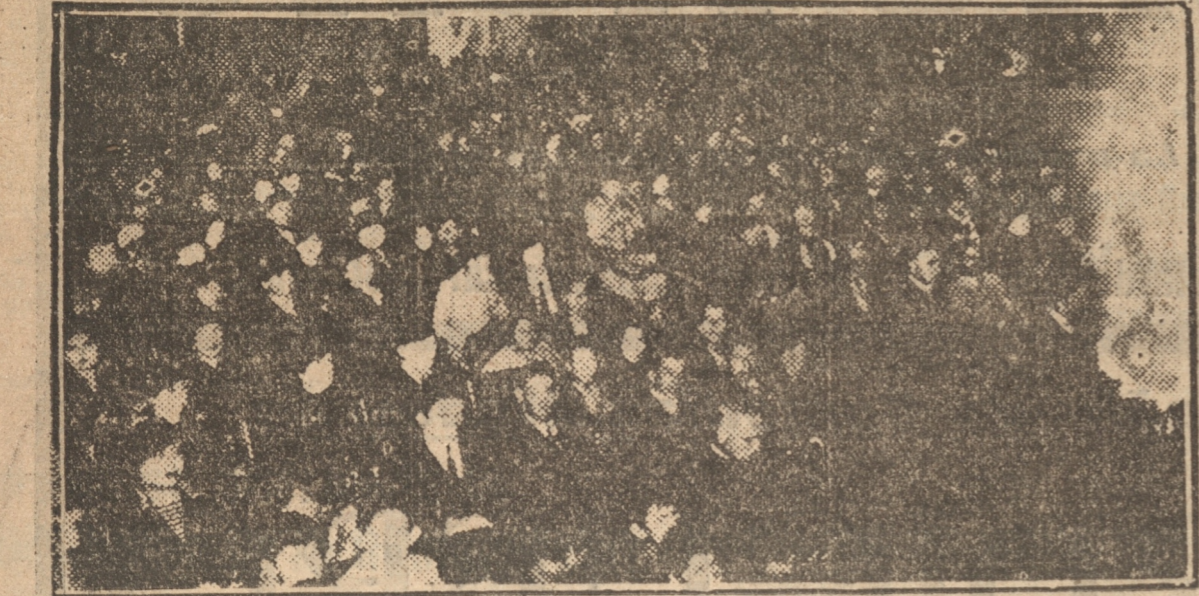
FOTOGRAFIA TOMADA EN EL TEATRO CONCEPCION, DURANTE LA ASAMBLEA DE LA TARDE