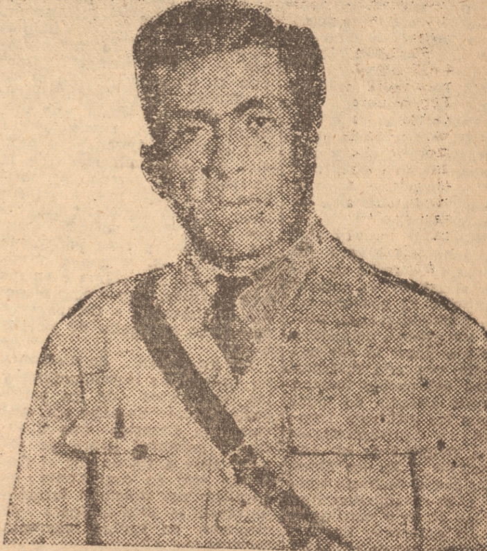
GENERAL LUIS SANCHEZ CERRO, ex-Presidente de Perú, que hace un año fué asesinado

Ayer se ofició una misa de campaña en la Plazuela del Hipódromo, en mismo sitio donde el malogrado Presidente fué herido mortalmente hace un año