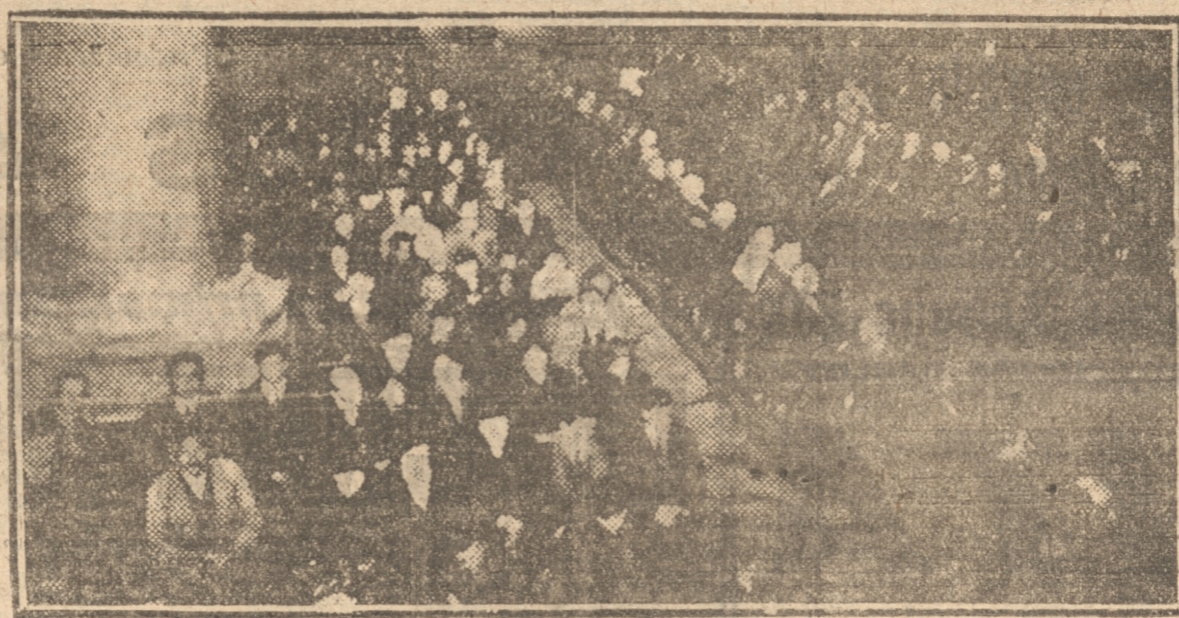
VISTA PARCIAL DE LA ENORME CONCURRENCIA QUE LLENABA COMPLETAMENTE LA CATEDRAL DURANTE LA SOLEMNE PONTIFICAL

Hermoso era el aspecto que ofrecía la Catedral durante la ceremonia. En el altar mayor, rodeado de luces, sobresalía un gran cuadro de Don Bosco. En la nave central se