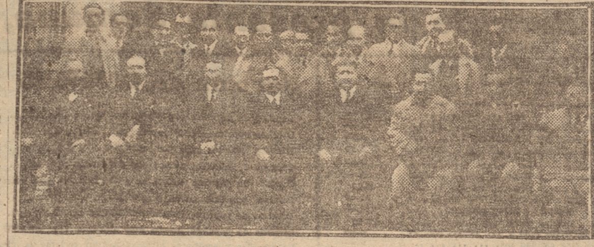
ASISTENTE A LA INAUGURACION DE LA CASA DE LIMPIEZA

Se dio término al acto de la inauguración cerca de las 12 horas.