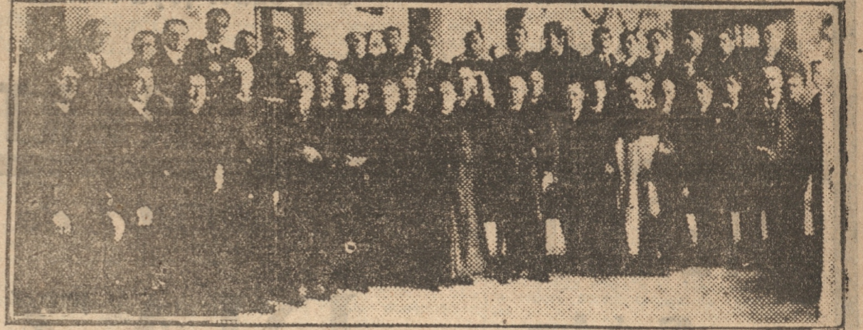
AUTORIDADES ECLESIASTICAS Y CIVILES Y PARTE DE LOS ASISTENTES AL BANQUETE

En perfectas condiciones se hizo la transmisión de los diversos números desarrollados en la Asamblea, lo que fué escuchado por gran cantidad de autoridades de la ciudad y de la región.