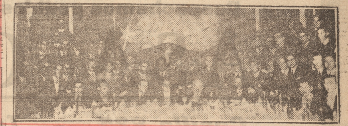
ASISTENTES A LA COMIDA DE ANOCHÉ EN EL HOTEL MEDICI

EL NUMERO FINAL FUE EL BANQUETE EN EL HOTEL MEDICI La manifestación se desarrolló en forma muy cordial, haciéndose gran número de recuerdos de la vida estudiantil. Se dio término a ella, poco antes de la medianoche, retirándose todos los asistentes muy gratamente impresionados de los momentos que tuvieron oportunidad de pasar en ella.