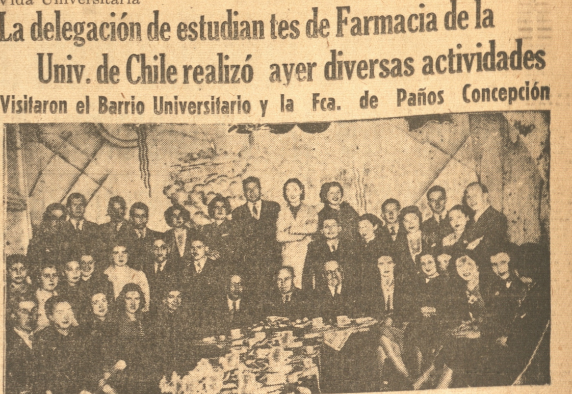
ASISTENTES A LAS ONCE EN HONOR DE LOS ESTUDIANTES SANTIAGUINOS