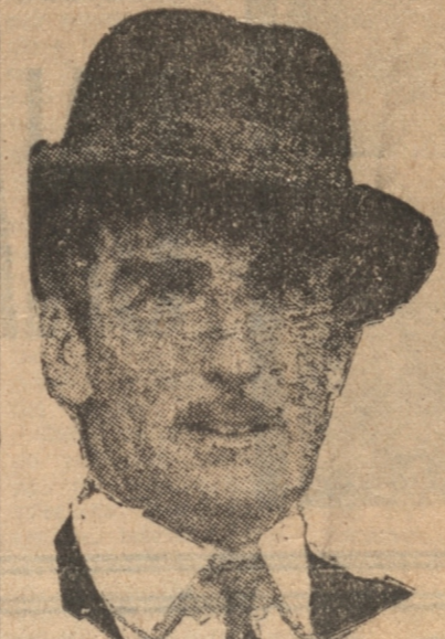
CAPITAN EDEN Enviado del Gobierno británico