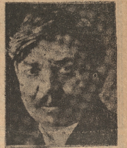
PIERRE LAVAL Servirá de mediador entre Italia y Gran Bretaña

Hace algún tiempo, el estado mayor general de Francia, danóse cuenta que las condiciones entre ambos países habían mejorado notablemente desde la visita de M. Laval a Roma, pudo retirar grandes masas de tropas en la frontera franco-italiana, transportándolas a la frontera franco-alemana, y dejando la anterior a merced de un cuerpo militar raquítico.