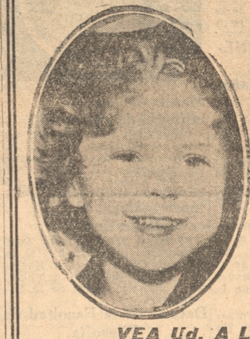
VEA Ud. A LA MARAVILLA DEL SIGLO