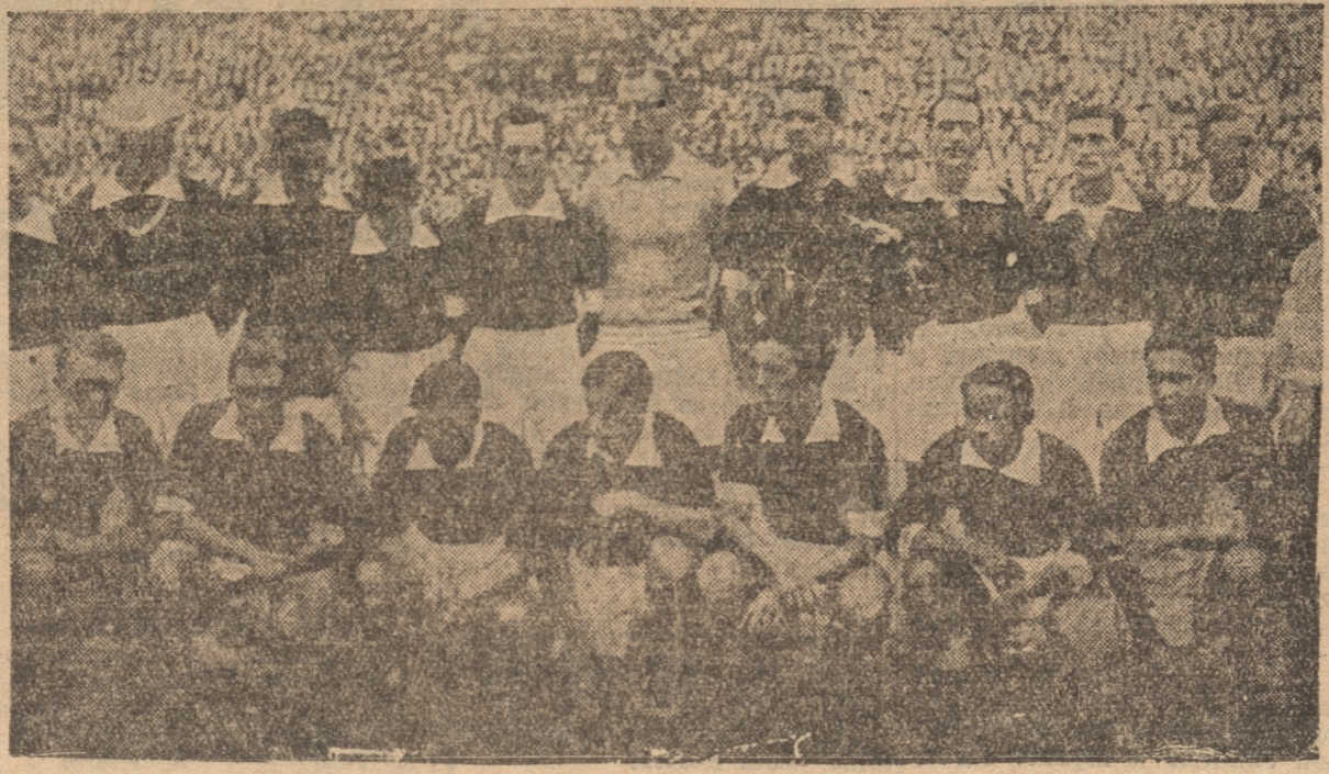
EQUIPO URUGUAYO, CAMPEON UNA VEZ MAS DEL FÚTBOL SUDAMERICANO

Esta es nuestra manera de pensar sobre el particular. Decir que el cuadro chileno perdió porque no fue bien elegido, porque la disciplina no se mantuvo y faltó la capacidad técnica, es confirmar lo que hemos escrito y confesarse cómplice de lo