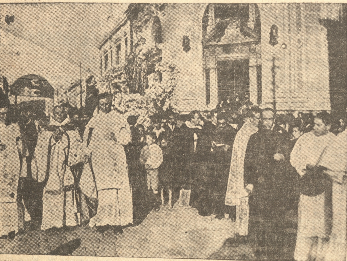
UN ASPECTO DE LA PROCESION REALIZADA AYER EN HONOR DE LA VIRGEN DEL ROSARIO

Realmente que solemne resultó la procesión de la Virgen del Rosario que ayer realizaron los PP. Dominicos con la valiosa cooperación de innumerables vecinos de Concepción devotos de la Virgen María.