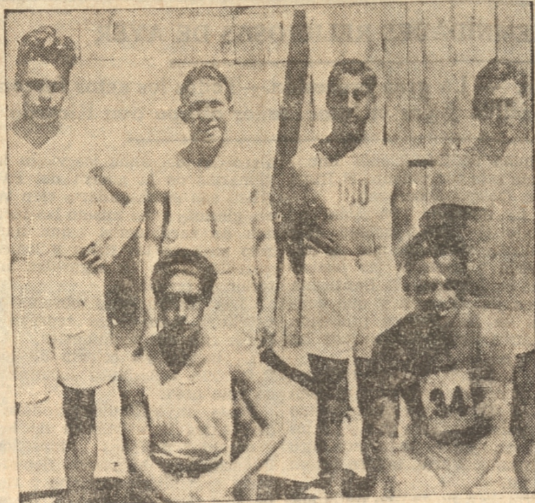
LOS VENCEDORES POSAN PARA "LA PATRIA"