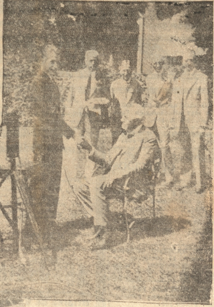
EDISON SALUDANDO A UN AVENTAJADO ALUMNO DE SUS CURSOS DE ELECTRICIDAD