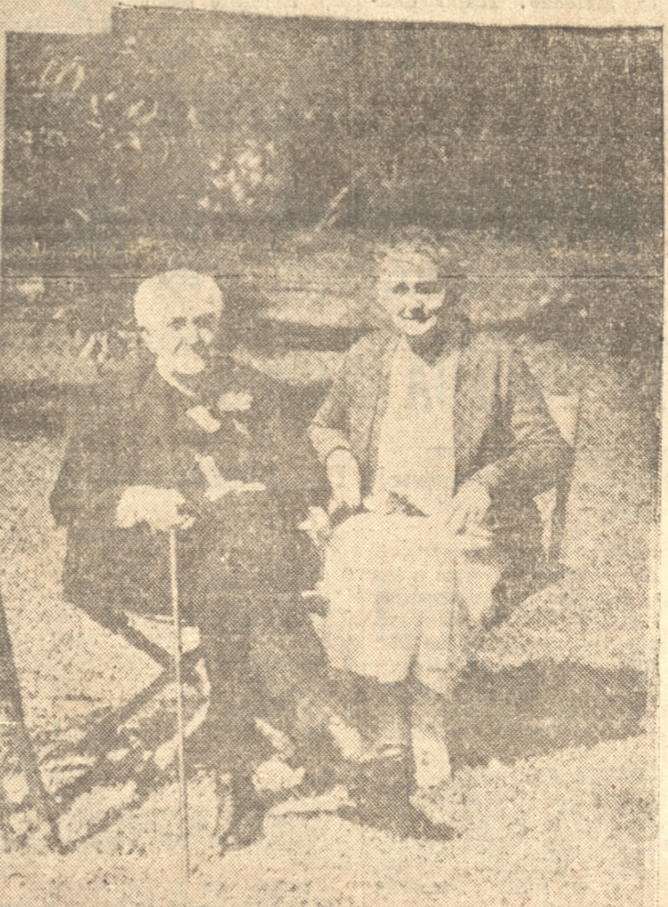
EDISON Y SU ESPOSA. FOTOGRAFIA TOMADA EN EL JARDIN DE LA CASA DEL INVENTOR EL DIA QUE CUMPLIO 84 AÑOS, EN FEBRERO DE ESTE AÑO