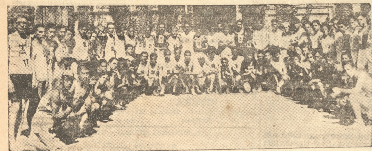
EL TOTAL DE COMPEIDORES DE LA GRAN PRUEBA DE AYER

Los premios otorgados a los competidores en este grupo fueron por el primero una plaqueta con estuche, de la Dirección General de Educación Física; para los tercero, cuarto y quinto se donaron plaquetas y medallas de la Dirección General de Educación Física, y para el 6.º y 7.º medallas donadas por el señor Loesche.