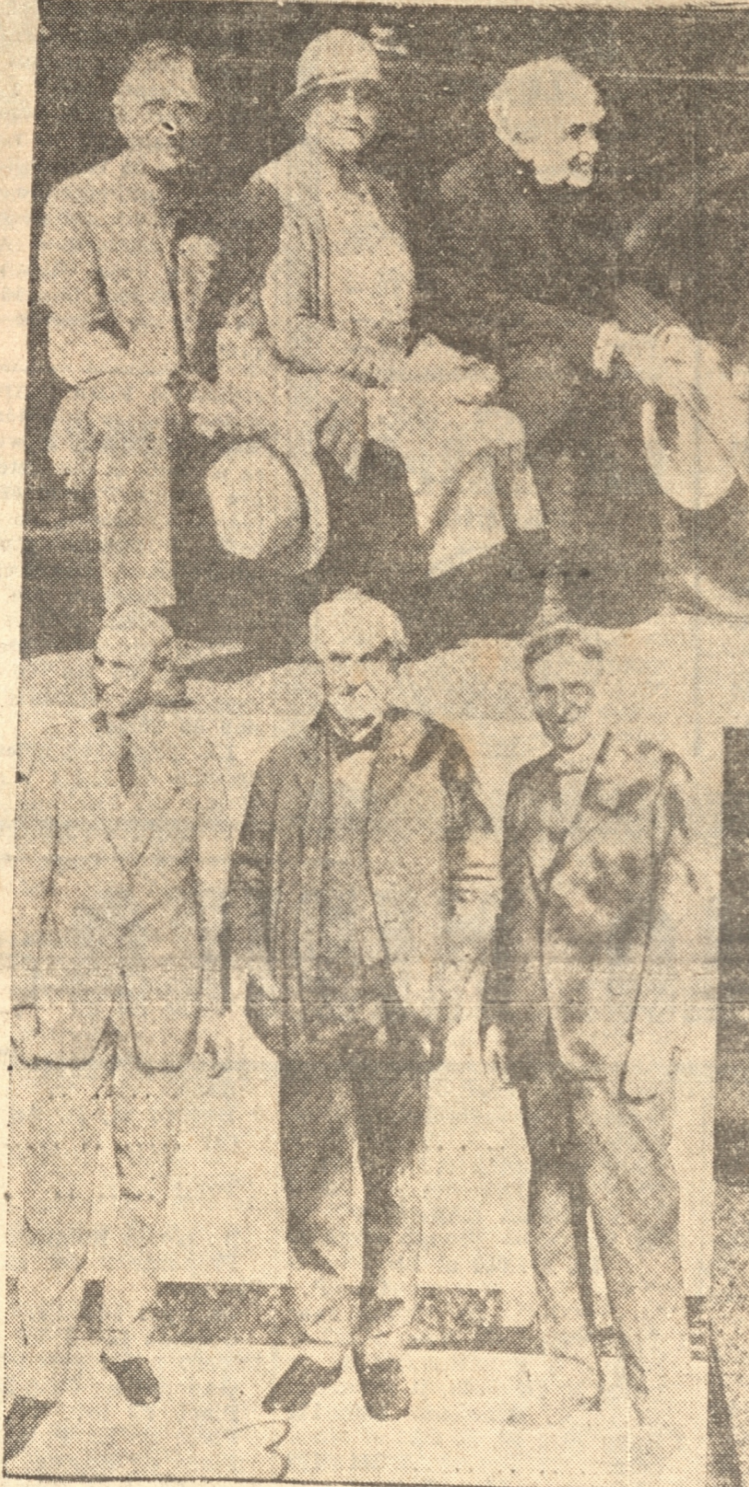
(Arriba).— Edison acompañado de su esposa y Mr. Harvey Firestone, en el auto de este último. — (Abajo).— El genial inventor acompañado de dos de sus mejores amigos: Henry Ford, el creador del transporte mecánico, y Mr. Harvey Firestone, el millonario industrial.

te de la noche dedicado a sus experimentos, acostumbraba dormir durante el desempeño de sus funciones en el día. Sorprendido "cabeceando" varias veces, se le dió orden de enviar la señal "A" cada hora a la estación vecina para demostrar de esta manera que se encontraba despierto. Esto llevó a Edison a idear su primer invento serio. Así fué como hizo un aparito que automáticamente enviaba la señal "A" con intervalos de una hora, tal como se le había ordenado a él que lo hiciera. El aparato trabajó perfectamente durante mucho tiempo, hasta que un día, sin embargo, fué sorprendido y se le despidió.