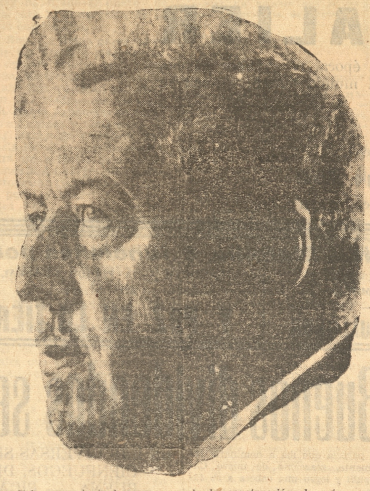
Dr. Eckener, principal promotor de la construcción de estas naves aéreas.