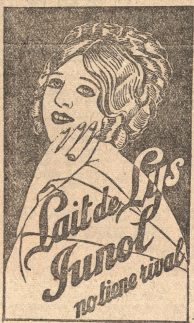
Lait de Lys Junol no tiene rival