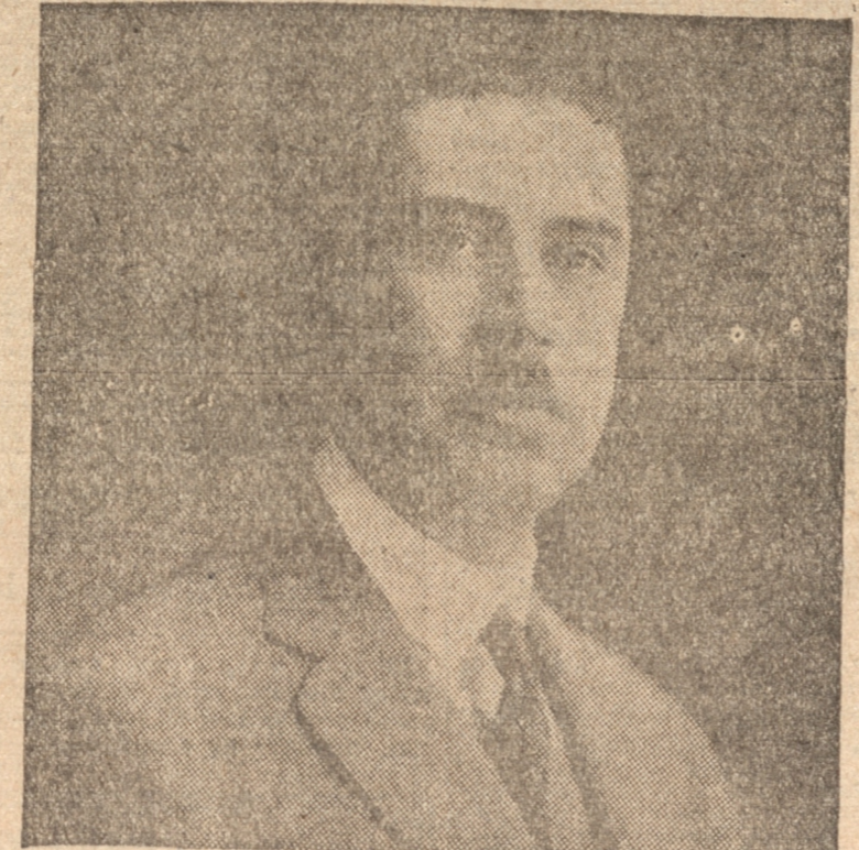
Don Héctor Rodríguez de la Sotta, vigorosa personalidad política, de nuestro país y estadista de sólidos prestigios, que es llevado por el Partido Conservador a las urnas como candidato a la Primera Magistratura de la Nación.

mir un triunfo por encima de la mayoría sobre los demás candidatos.