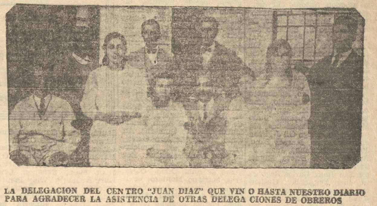
LA DELEGACION DEL CENTRO "JUAN DIAZ" QUE VENIA O HASTA NUESTRO DIARIO PARA AGRADECER LA ASISTENCIA DE OTRAS DELEGACIONES DE OBREROS

menterio, la concurrencia se estableció en la rotunda, con el objeto de escuchar los discursos.