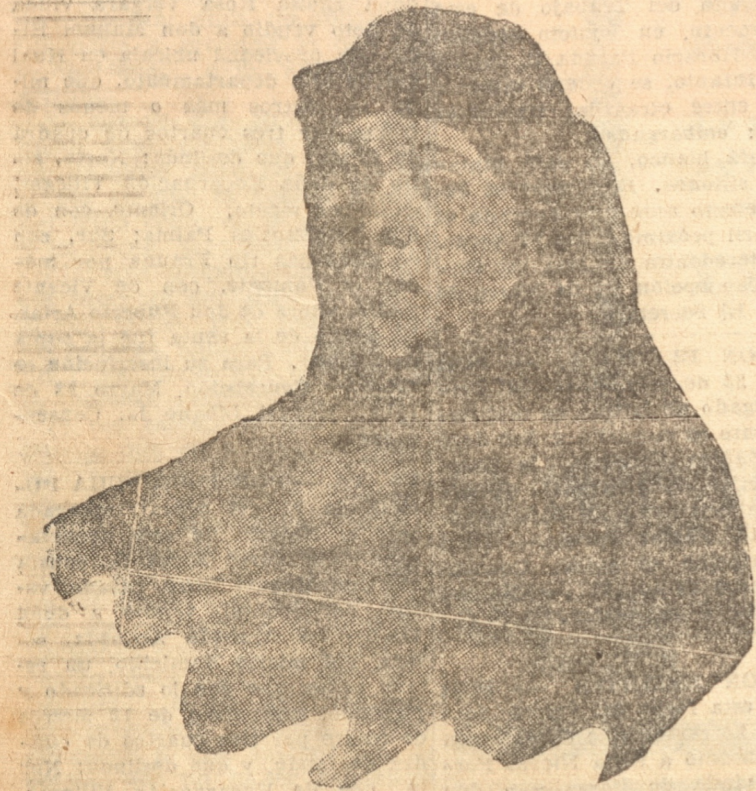
"PANQUEHUE", TIPO ARAUCANO

En La Prensa de Buenos Aires encontramos un interesante artículo, a página notable por el trabajo que desarrolló en Chile el artista mendocino Ramón Subirats, que recogió en sus lápices los tipos más interesantes del sur de nuestro país: Concepción, Temuco y otras ciudades proporcionaron al talento de Subirats la oportunidad de re-