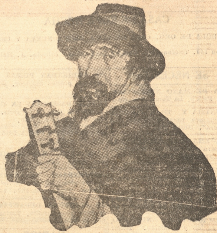
"EL GUITARRERO", DEL SUR DE CHILE

Dentro de poco, el público de Buenos Aires podrá apreciar en conjunto esta nueva muestra de Subirats. Labor honrada, honro