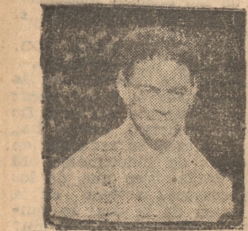
ELGUETA el veterano y siempre firme centro half del Lord Cochrane

Es muy posible que el team campeón del fútbol local de la temporada de 1934, Lord Cochrane acuda a Santiago al Campeonato Nacional de Fútbol Amateur que ha organizado la Asociación de la capital y a la cual concurrirán los mejores teams campeones de las asociaciones del país. Sabemos que la entidad verde ha aceptado en principio la participación en este campeonato y sólo espera datos sobre los días de duración de dicho certamen y las condiciones financieras a que estaría sometido el viaje de los campeones del fútbol de Concepción.