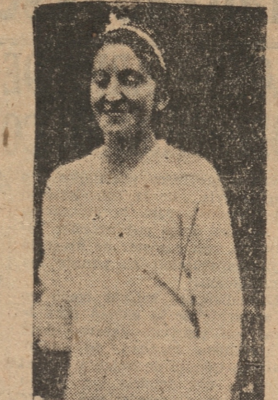
ANITA LIZANA va a Europa en forma casi fija ya.

De buena fuente se informa desde Santiago que está ya casi finalizado el viaje de la celebrada tenista de fama sudamericana Anita Lizana a Europa.