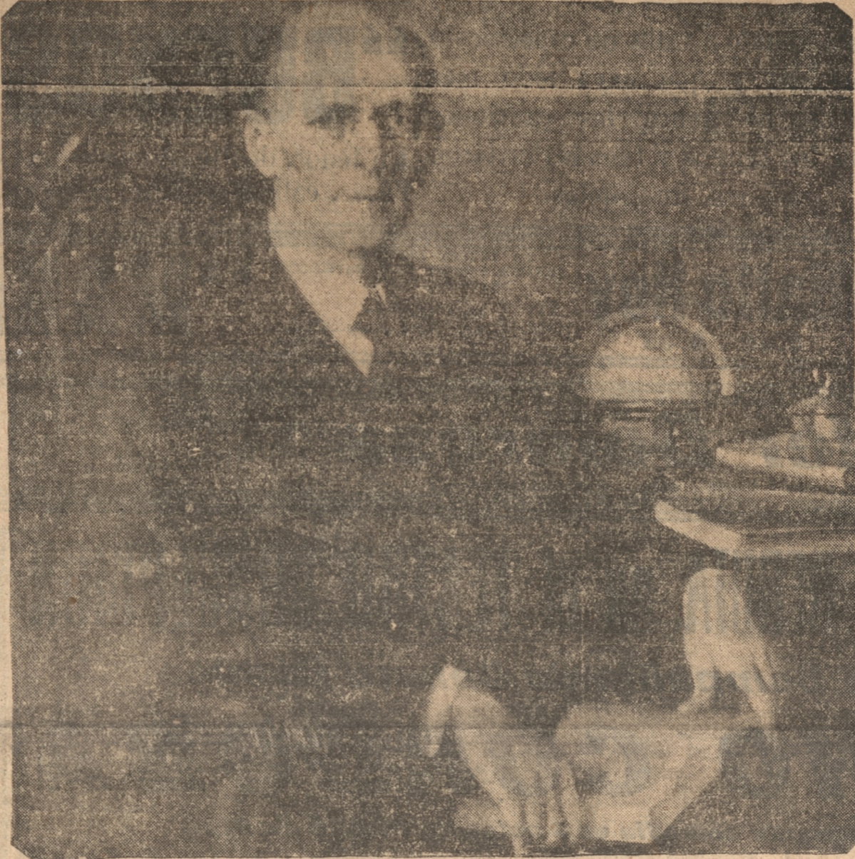
SR. PAUL HARRIS FUNDADOR DEL ROTARY INTERNACIONAL

LA INSCRIPCIÓN DE LOS DELEGADOS SE EFECTUARÁ EN LOS ALTOS DEL CLUB CONCEPCION DE 10 A 12 HS. — A LAS 17.30 HS. SE EFECTUARÁ LA SOLEMNE SESIÓN INAUGURAL EN EL SALÓN DE HONOR DE LA UNIVERSIDAD