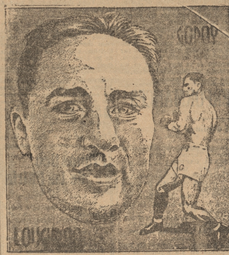
AQUI TENEMOS a los dos rivales de hoy. Tommy Loughran y el chileno Arturo Godoy. Pelean por tercera vez. Tienen un empate, un triunfo Loughran por puntos y hoy, ¿quién ganará?