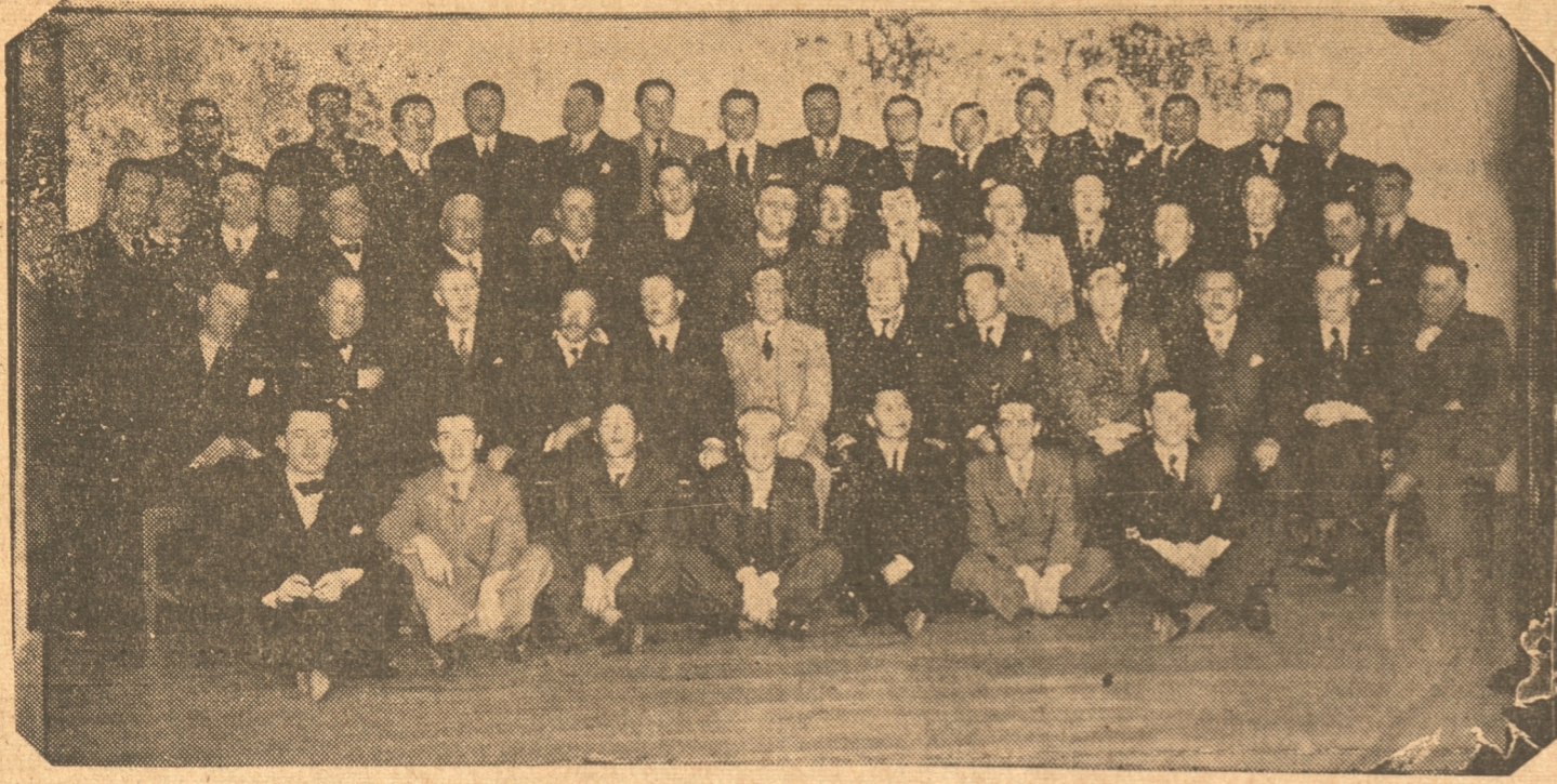
Asistentes a la manifestación de anoche en el Cecil Hotel

Ayer se llevaron a efecto diversos actos en celebración del "Día del Viajante". festividad con que los viajeros comerciales celebran el 20 aniversario de su Asociación.