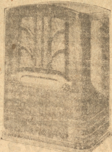
LUEGO EMPEZARA EL CANJE Una vez que demos a conocer las bases, iniciaremos el canje de cupones para el sorteo...