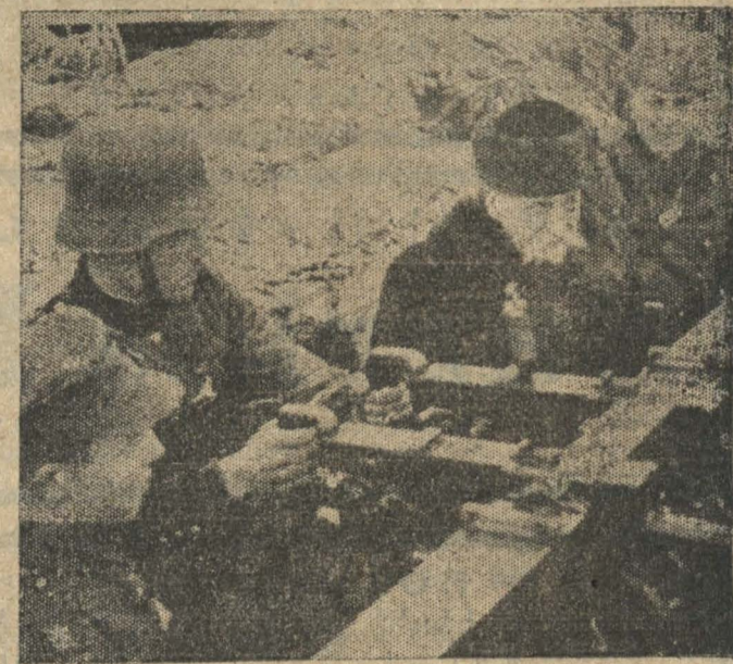
EL PRESIDENTE KALLIO, de Finlandia, durante una visita de inspección a las trincheras, en la línea Mannerheim. Lo acompañan soldados del ejército finlandés.

NEW YORK, 22. — (UP.) — El Directorio de la Compañía Andes Coper Mining Company acordó un dividendo de veinticinco centavos como operación de la emisión común pagadero el quince de marzo a los accionistas inscritos en los registros hasta el ocho de marzo.