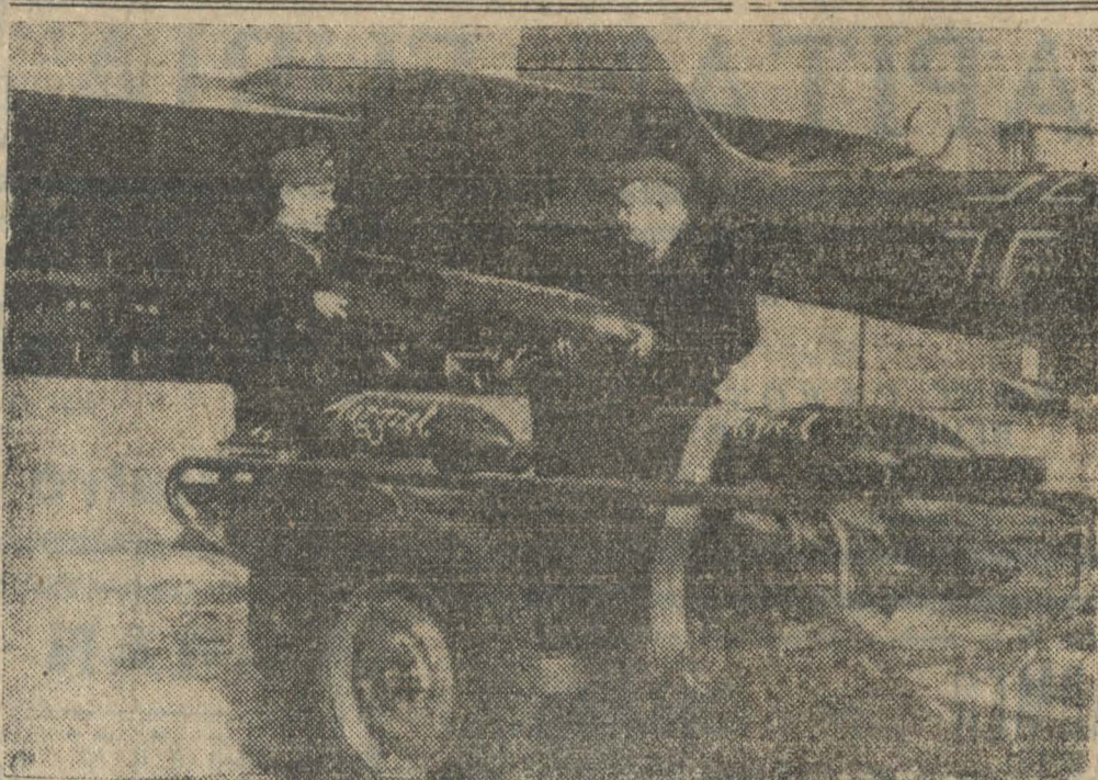
BOMBAS ALEMANAS PARA INGLATERRA. — En un carro especial, las bombas de gran calibre son conducidas a los aviones de bombardeo alemanes, antes de iniciar sus raids sobre las Islas Británicas. Pero hasta en estas tareas prevalece el buen humor de la actual guerra, cuando cada bomba lleva una dedicatoria y un nombre.

Carteles fijados el jueves en la mañana en Helsinki llamaron a estas clases a presentarse en las oficinas de conscripción hasta el 28 de febrero.