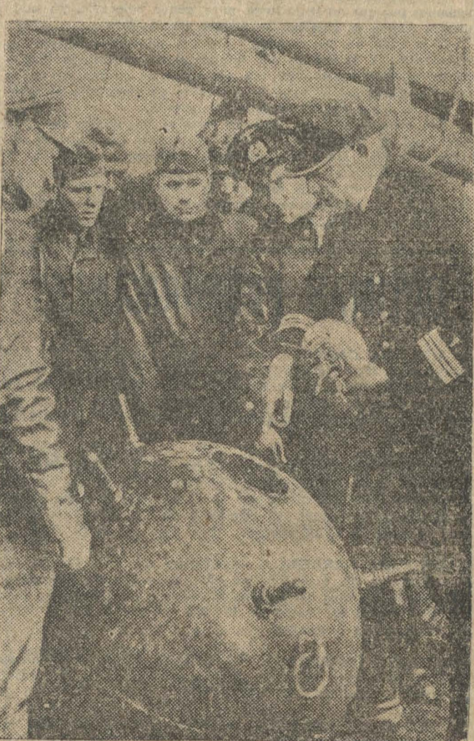
UN ARMA FORMIDABLE. — Alumnos de una academia naval alemana recibiendo instrucciones acerca de la construcción de una mina.