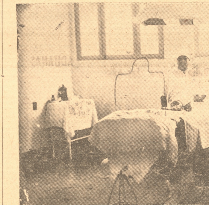
SALA DE OPERACIONES DEL PENSIONADO RECIENTEMENTE INAURADA

Se nos informó que para las salas del hospital serán destinados 750 mil pesos que apenas alcanzarán para cambiar los ac- Se nos informó que para las salas del hospital serán destinados 750 mil pesos que apenas alcanzarán para cambiar los ac-