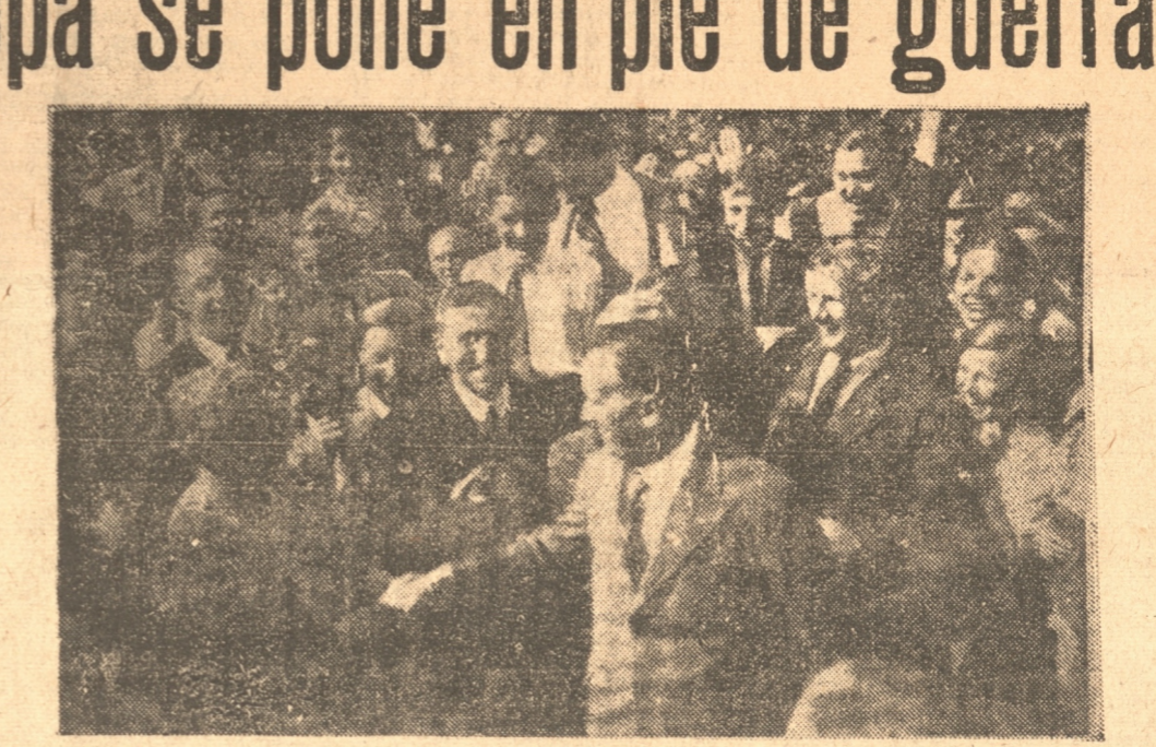
Henlein, rodeado de un grupo de sus partidarios, en una manifestación efectuada poco antes de producirse la actual crisis

TODA LA FUERZA AEREA BRITANICA LONDRES 26. (U. P.). — En Ministerio del Aire llamó a toda la fuerza aérea, desde los jefes hasta los soldados, como también al cuerpo de observa-