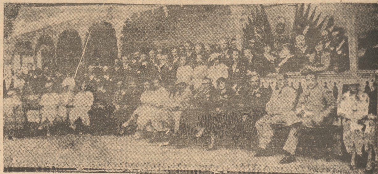
LOS ROTARIOS DURANTE LA VISITA DE AYER A LOTA