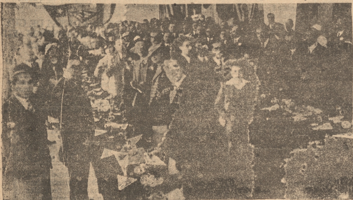
DURANTE LA RECEPCION OFRECIDA POR LA FABRICA DE PAÑOS CONCEPCION