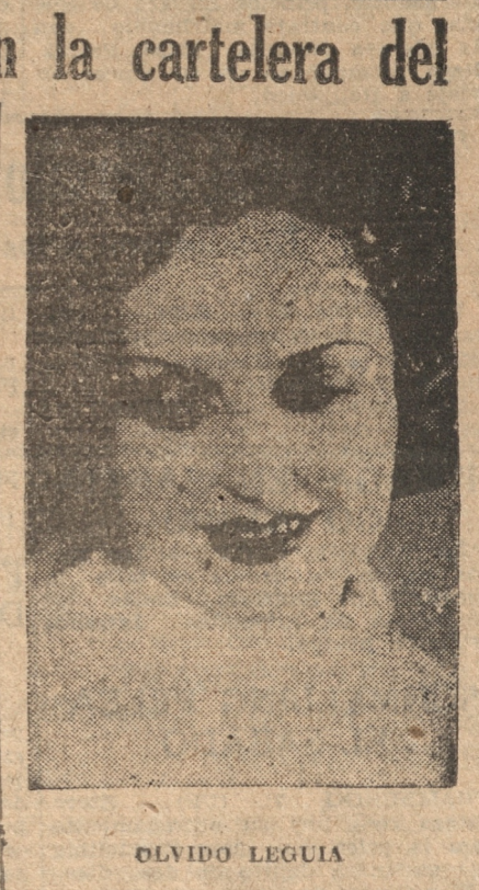
OLVIDO LEGUIA Las entradas como de costumbre se venden durante todo el día en la Confitería Palet, hasta las seis de la tarde, después en la boletería del Teatro.

"Marineros en tierra", represa el Prat Nuevamente está en las funciones de hoy en el teatro Prat.