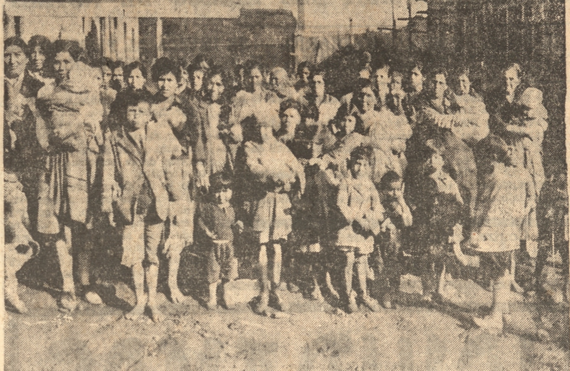
GRUPO DE LA DELEGACION DE LA ESCUELA TECNICA FEMENINA Y DE LAS DAMAS DEL COMITE DEL SAGRARIO ALGUNOS DE LOS CESANTES CON LOS OBSEQUIOS QUE RECIBIERON AYER

SITIO VIVA GRATIS Sitiecito, vendido en $ 1.090. — Caupolicán 555 — LUIS RIFFO