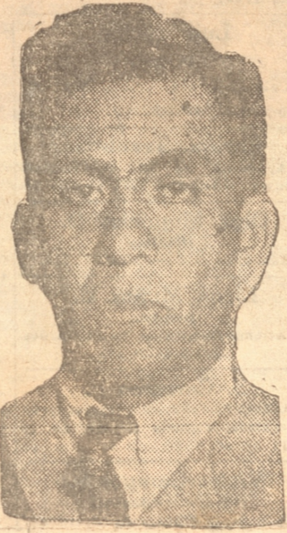
EL COMANDANTE SANCHEZ CERRO QUE RENUNCIO AYER

(Triple).— El comandante Sánchez Cerro renunció a la Presidencia de la Junta de Gobierno. Igual cosa hicieron los demás miembros de la Junta. REUNION DE LOS PRINCIPALES CIUDADANOS DE LIMA LIMA, 1.º (U. P.).— A las cuatro de la madrugada, la Junta convocó a una reunión para las tres de la tarde, a cuarenta y cinco de los principales ciudadanos de Lima, entre los que figuraban el Arzobispo, el rector de la Universidad y los jefes de las agrupaciones políticas para tratar de hallar los medios para solucionar pacíficamente las dificultades políticas. LOS TRANSPORTES "RIMAC" Y "APURIMAC" ANCLADOS EN LA ISLA SAN LORENZO LIMA, 1.º (U. P.).— Los transportes "Rimac" y "Apurimac", que conducían al sur a dos mil soldados, se encuentran anclados detrás de la isla San Lorenzo. Según dicen los diarios de la mañana, los cruceros "Gran" y "Lima" les impidieron la salida para Mollendo, como estaba ordenado.