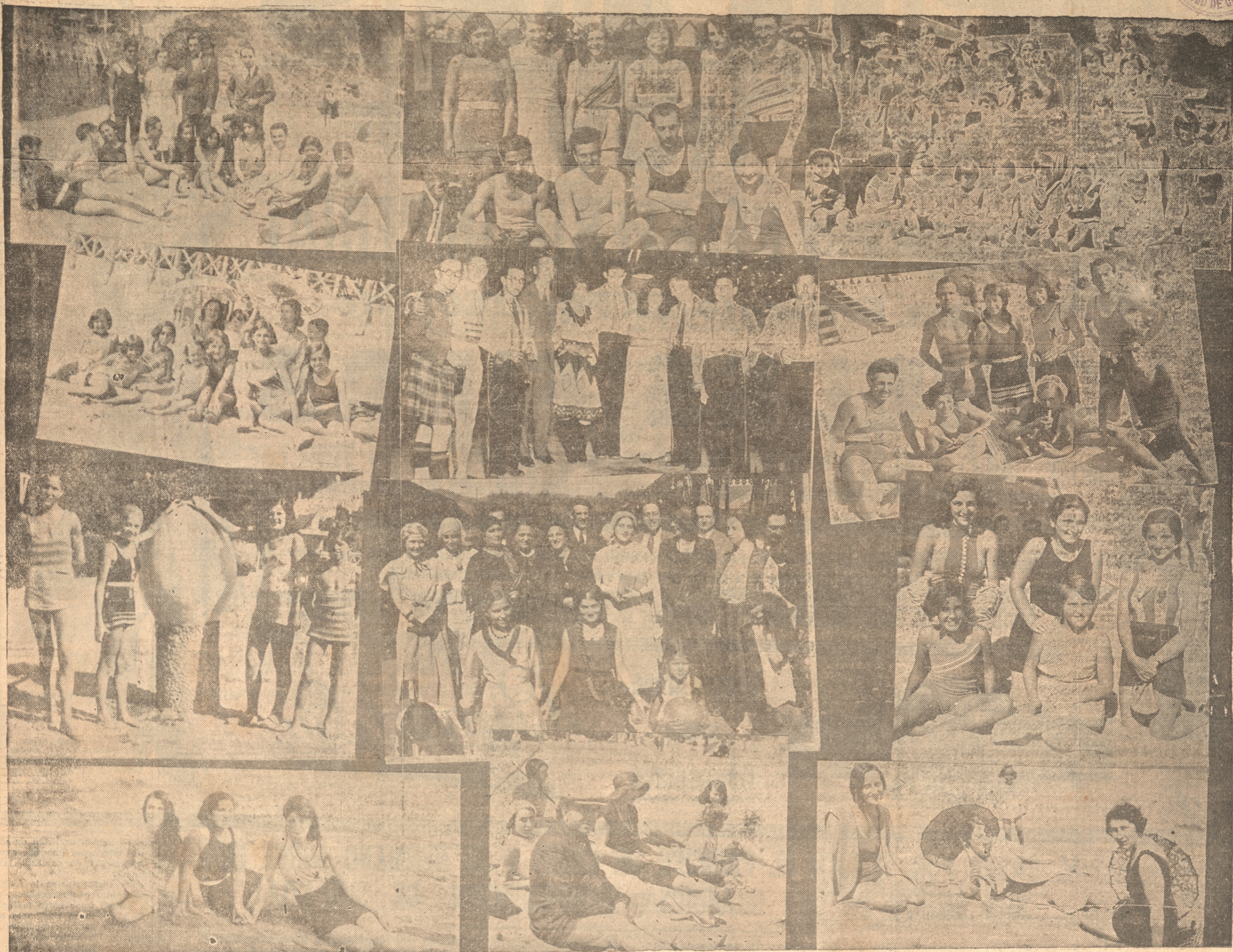
Interesantes instantáneas tomadas durante el veraneo en el vecino balneario de Tomé