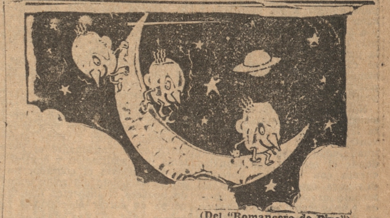
(Del "Romancero de Pipo")

El Director General de la Armada vino hoy a Santiago a la sesión del consejo de la caja de Retiro de las Fuerzas Armadas. Pasó a complimentar al ministro de Defensa.