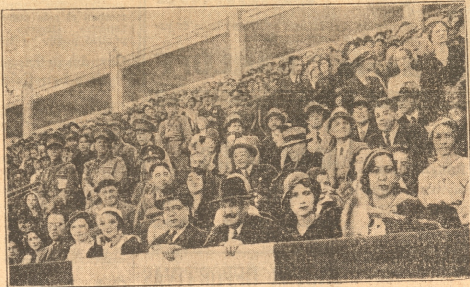
Presenciando un juego de fútbol a 2.000 metros sobre el nivel del mar, en Méjico, D. F. En el grupo figuran altos funcionarios, diplomáticos extranjeros, damas aristocráticas y oficiales del ejército, así como una pequeña parte de la gran masa del público